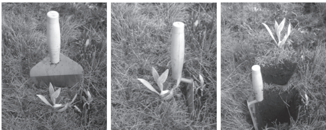
Fig. 1. Extracción de plantas jóvenes de E. grandiflora para ser reubicados en pastizales de páramo.

La probabilidad de supervivencia de las plantas se calculó a los 3.1, 9.5, 13.1, 18.7 y 24 meses luego de la reubicación. En el caso