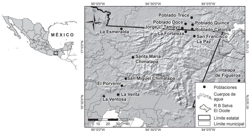
Fig. 1. Selva de los Chimalapas, Oaxaca, México. Fig. 1. Study site in Chimalapas forest, Oaxaca, Mexico.

En la Fortaleza viven cerca de 120 personas, agrupadas en 30 familias. Todos hablan español y algunos pobladores dominan algún idioma indígena. La mayoría de los jóvenes y adultos de la congregación se dedican a la ganadería extensiva de doble propósito, la cual es una de las actividades más recurrentes de la región. De forma temporal cultivan hortalizas (maíz, frijol y calabaza), como forma de subsistencia. Adicionalmente, y para complementar