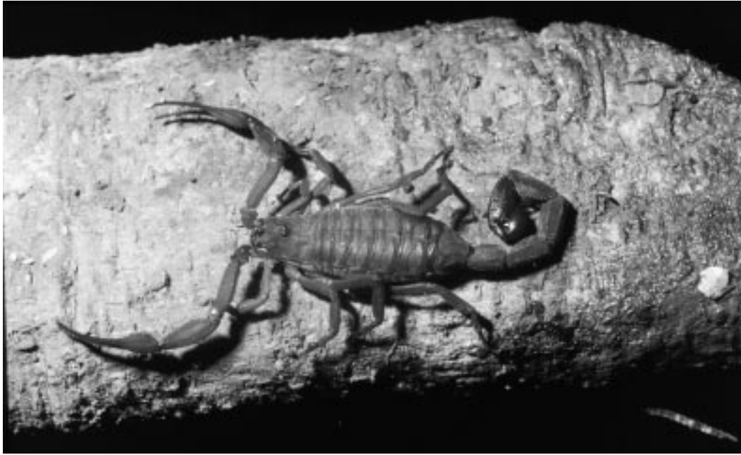
Fig. 3. Hembra de Tityus dedoslargos Francke y Stockwell, recolectada en la localidad de Cerro Nara, Dota.