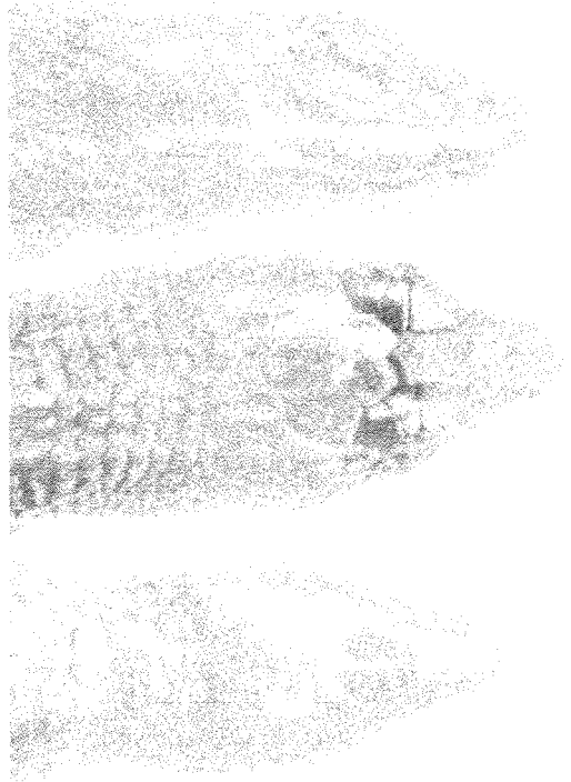
Fig. 2. Cabeza de Prionodactylus ampuedai (MCNC 7502) en vista lateral (arriba), dorsal (medio) y ventral (abajo). Longitud de la cabeza: 13.4 mm.