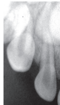
Figura 2 Canino superior primario geminado