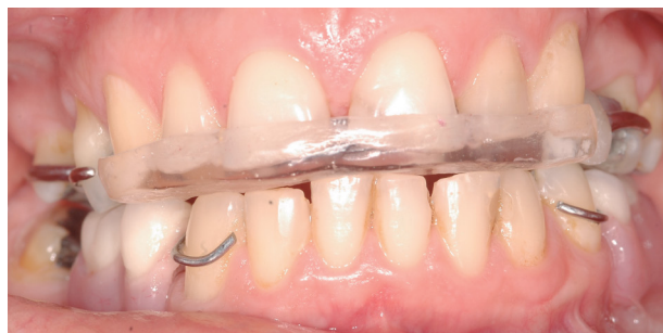
Fotografía 6. Vista frontal, entrega de las prótesis removibles superior e inferior relación céntrica, con el plano anterior de mordida para evitar la extrusión de las piezas antero superiores e inferiores.

Se entregaron las Prótesis parciales removibles y se controlaron durante un mes, una vez cada semana. El cuadro de dolor se redujo y la ingesta de medicamentos también.