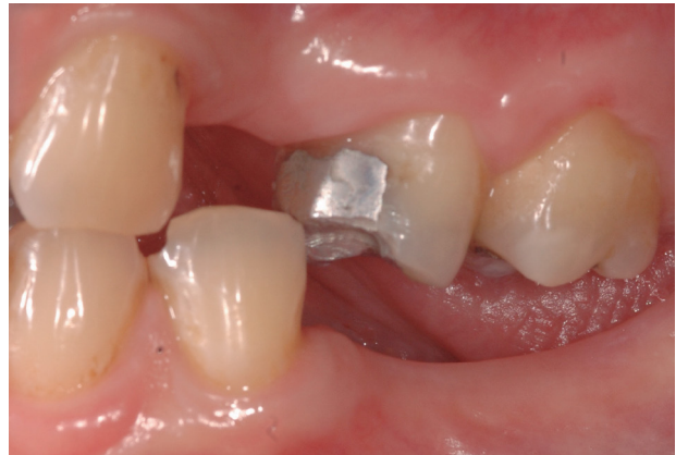
Fotografía 4. Vista lateral izquierda, relación céntrica. Se abre la Dimensión Vertical y posibilita la reposición protésica. ¿Relación céntrica, posición forzada e inútil como referencia de tratamiento en los DTM?.

Relación céntrica con discrepancia con Oclusión céntrica, cuyo contacto mantiene una Dimensión Vertical en oclusión diferente a la que tiene con la Oclusión céntrica. (Fotografía 4)