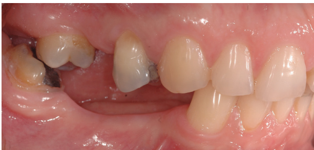
Fotografía 2. Vista lateral derecha, oclusión céntrica. Falta de soporte posterior tanto en la mandíbula como en el maxilar superior.

En el examen dental clínico, presenta restauraciones de amalgama de plata, ausencia de piezas dentales posteriores bilateral (sin reposición protésica).