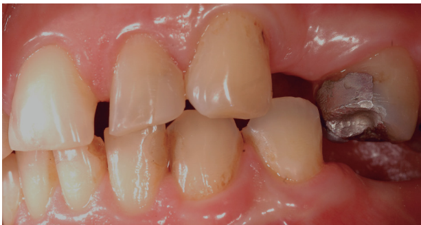
Fotografía 3. Vista lateral izquierda, oclusión céntrica. La mandíbula queda atrapada y se inmoviliza, se reduce las posibilidades de tener una posición "descansada". ¿Oclusión céntrica como posición de referencia en el tratamiento?.

En el examen dental clínico, presenta restauraciones de amalgama de plata, ausencia de piezas dentales posteriores bilateral (sin reposición protésica).