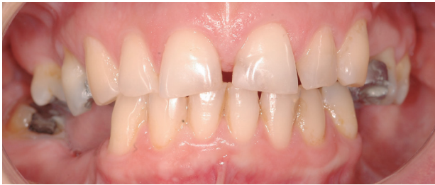
Fotografía 1. Vista frontal, el paciente en Oclusión Céntrica. Aparente "buenas condiciones" para atender con prótesis removibles superior e inferior.

la cual ella intentó resolver vía medicamento. Examen intraoral: (Fotografía 1-3)