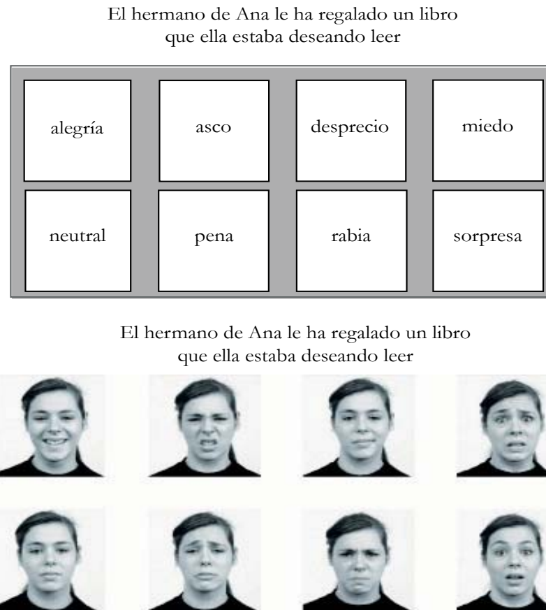
Figura 1. Ítem 1 del test de comprensión de emociones en ambos formatos.

de respuesta difieren en el formato: verbal o imagen (ver Figura 1). Las etiquetas de los ocho botones de respuesta verbal son: desprecio, rabia, asco, miedo, pena, sorpresa, alegría y neutral.