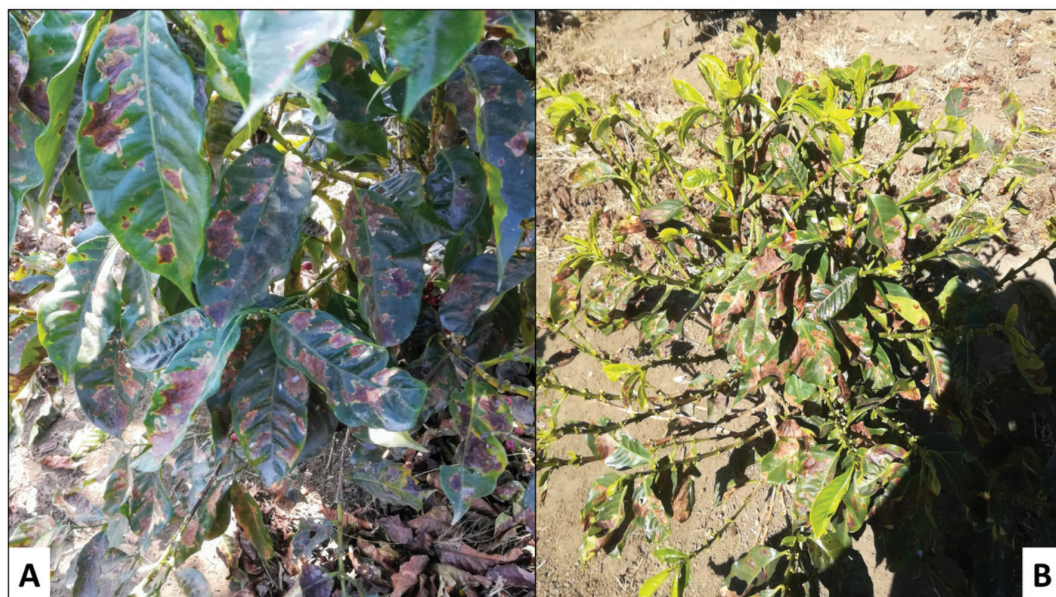
Figura 2. Daño foliar severo (A) (B) Defoliación causada por L. coffeella . Purrál, Goicoechea. Febrero, 2019.