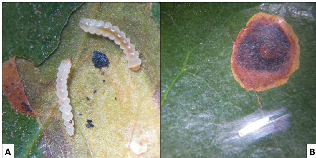
Figura 1. Larvas (A) (B) Pupa característica de L. coffeella .