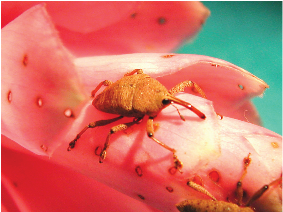
Fig. 1. Daño a la flor de ginger rosado y adulto de Choluta pilicauda .

plantas de la familia Zingiberaceae, a la cual pertenece el ginger, la maraca amarilla ( Zingiber zerumbet ) y el bastón del emperador ( Etilingera eliator ). La hembra deposita los huevos en la base de los pseudotallos, sobre todo en sitios bajo sombra densa; las larvas se desarrollan y completan el ciclo de vida en las raíces, una vez que emergen los adultos, estos se alimentan de las flores (Coto y Saunders 2004). El daño a las flores lo ocasionan los adultos con el rostrum (pico) durante la alimentación y con los pulvilos (uña en patas) mientras se posan para alimentarse (Figura 1).