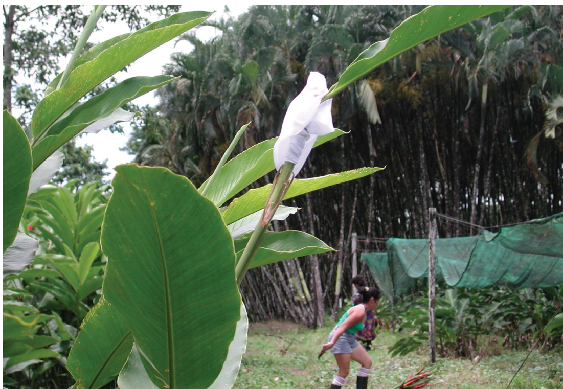
Fig. 2. Embolse del botón floral de ginger rosado.

Preparación del extracto. Los frutos de pichichío ( S. mammosum ) se recolectaron en Pococí, Limón. La preparación del extracto se