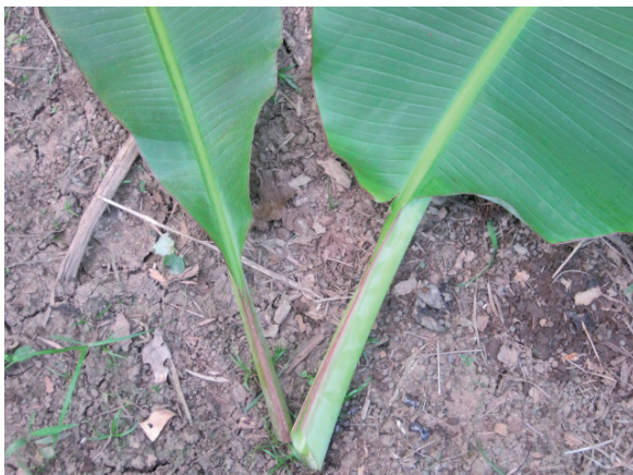
Figura 2. Variación morfológica de la base de los semilimbos (lóbulos) desde la última hoja emitida con ambos lóbulos aguzados hasta la primera hoja emitida con ambos lóbulos redondeados. Estudio IV. Matina, Limón, Costa Rica. 2012-2013.