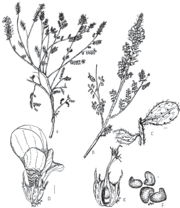
Figura 1. Dalea lutea (Cav.) Willd. A. Planta completa; B. Rama con hojas e inflorescencias; C. Hoja; D. Flor; E. Pistilo; F. Semillas. Tenancingo, Estado de México, México. 2002-2004.