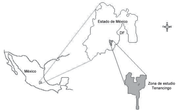
Figura 2. Zona de estudio: municipio de Tenancingo, Estado de México, México. 2002-2004.