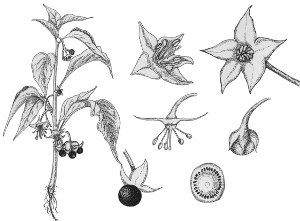
Figura 1. Dibujo de las partes constituyentes de una planta de Jaltomata procumbens (Cav.) J. L. Gentry forma erguida, recolectada en San Lorenzo Tlacotepec, municipio de Atlacomulco, Estado de México, México, 2006.

Jaltomata procumbens es una planta arbustiva (Figura 1) con tallo succulento de color verde; hojas simples con borde liso; flores de color verde blanquecino o amarillo pálido; el fruto es una baya de color negro con semillas pequeñas (Centurión et al. 2000; Davis y Bye 1982). Se distribuye por la República Mexicana sobre todo en climas templados y húmedos (Tovar 2005).