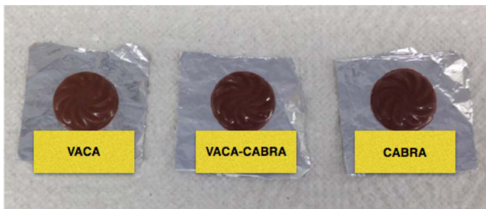
Figura 2. Imagen ilustrativa de una muestra de los tres chocolates elaborados con distintas proporciones de leche: 100 % leche de vaca, 50 % leche de vaca con 50 % leche de cabra y 100 % leche de cabra. Escuela de Tecnología de Alimentos (ETA) de la Universidad de Costa Rica, San José, Costa Rica. 2016.

**Tres diferentes porcentajes de incorporación de leche caprina y bovina: 100 % leche de vaca, 50 % leche de vaca con 50 % leche de cabra y 100 % leche de cabra. / Three different percentages of goat and cow milk: 100 % cow milk, 50 % cow milk with 50 % goat milk, and 100 % goat milk.