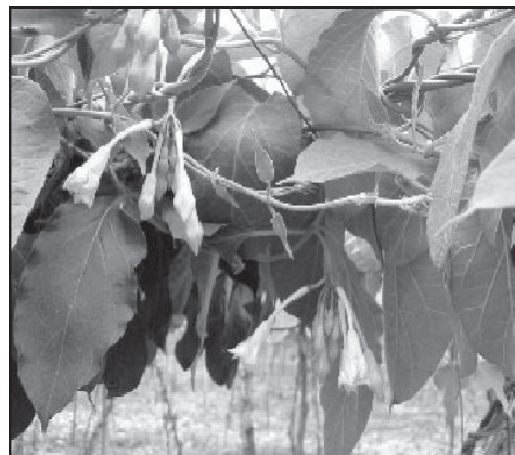
Figura 1. Estructura externa de la planta de loroco ( Fernaldia pandurata Woodson).

El loroco es un cultivo no tradicional, que representa una buena alternativa para generar ingresos. Dicho cultivo no había tenido importancia en cuanto a su valor comercial y nutritivo, aunque algunos agricultores lo explotan en forma tradicional debido a la resistencia de esta planta, lo que le permite crecer