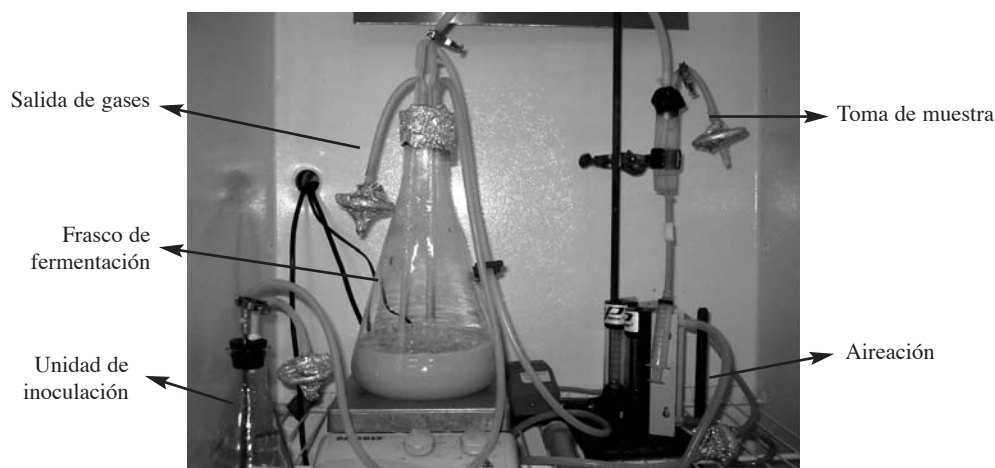
Figura 1. Esquema del equipo de fermentación utilizado para la selección del microorganismo a utilizar en la producción de proteína unicelular. Costa Rica, abril 2004-marzo 2005.

Se separaron las proteínas coagulables del suero de leche por medio de un tratamiento termoácido, en el que se ajustó el pH a 4,5 (HCl 1N) seguido de un calentamiento a 115 °C por 20 minutos en autoclave (Yamato, Scientific America Inc, Orangeburg). El suero se enfrió y se separaron las proteínas por decantación y filtrado con papel Whatman N°41. El contenido de proteína final del suero empleado en las fermentaciones fue de 0,38 %.