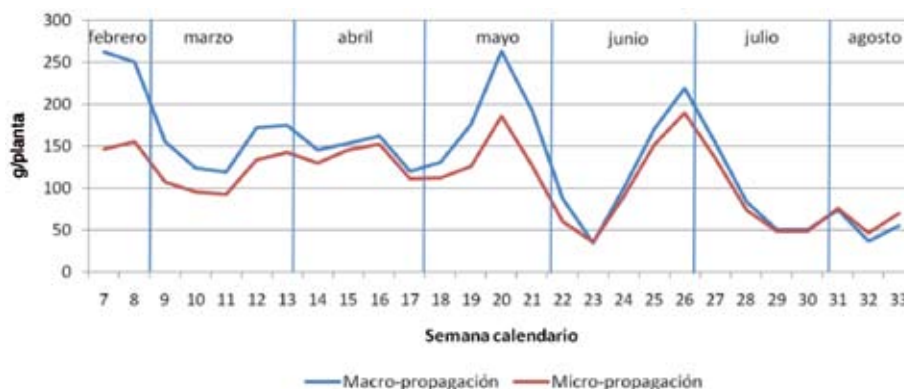
Figura 2. Producción por sistema de propagación (macro-propagación y micro-propagación) en mora ( R. adenotrichus var. ‘Vino Espina Roja’) en La Luchita del Guarco, Cartago. Cosecha 2008.