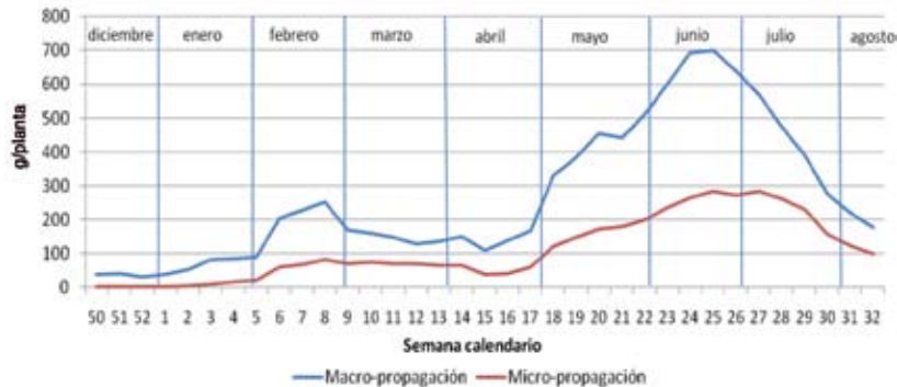
Figura 1. Producción por sistema de propagación (macro-propagación y micro-propagación) en mora ( R. adenotrichus var. 'Vino Espina Roja') en La Luchita del Guarco, Cartago. Cosecha 2007.

y luego trasladadas a campo, así como al estado juvenil que éstas presentan. Resultados similares fueron encontrados por Smith y Hamill (1996) al aclimatar y cultivar plantas de jengibre en campo, en donde se obtuvieron plantas de menor tamaño, asociando esta condición al estrés causado por la desecación de las hojas, al pobre desarrollo cuticular de las mismas y al cambio del fotoperiodo que enfrentan las plantas al ser sembradas en campo. Asimismo, estudios realizados por Pospíšilová et al. (1999) en plantas de Prunus serotina , evidencian que la densidad estomática y la longitud de los estomas decrecieron después de que fueron trasladadas al invernadero, lo que genera condiciones de estrés, reduciendo el vigor y el crecimiento de las plantas en campo.