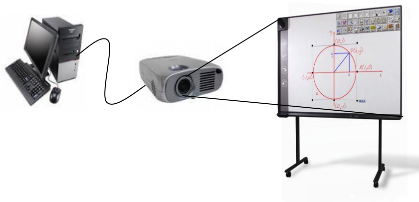
Figura 2. Pizarra digital interactiva

La principal diferencia entre ambas, como podemos apreciar si comparamos las pantallas de las Figuras 1 y 2, es la posibilidad que da la segunda de interacción directa con la superficie de la pizarra a través de los dispositivos adecuados. En cuanto a los elementos que la componen en ambos casos se necesita un ordenador (convenientemente con conexión a la Internet) y un proyector. Mientras que en la primera se utiliza una pizarra blanca normal para realizar las proyecciones en el segundo caso es necesario utilizar una pizarra que integre el "dispositivo de control de puntero" (o una pizarra blanca normal y un dispositivo de PDI portable que se acopla a la pizarra tradicional); en ambos casos, se debe incluir un pack de software PDI: driver PDI, tinta digital, editor multimedia, recursos de apoyo.