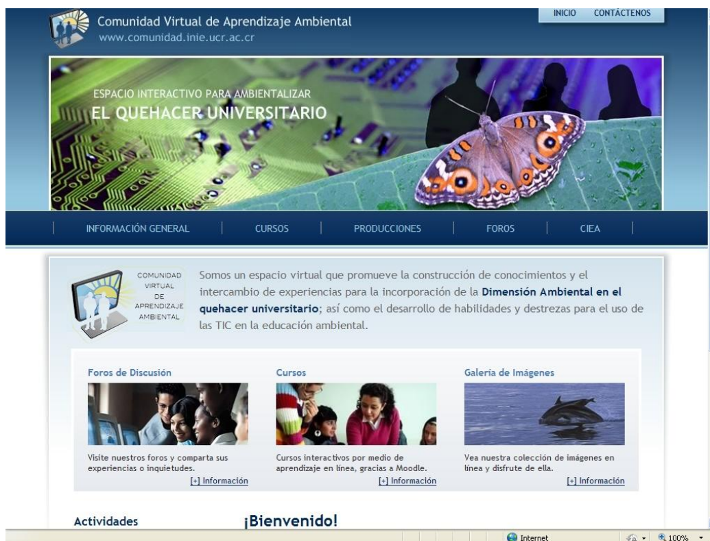
Portada del sitio Web de la Comunidad Virtual de Aprendizaje Ambiental