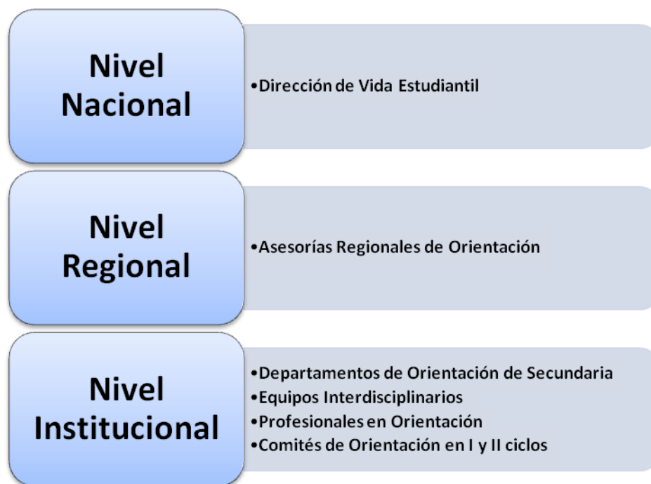
Figura 1 Presencia de Profesionales en Orientación, Ministerio de Educación Pública