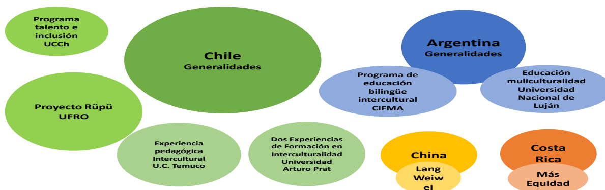
Figura 1: Experiencias de Inclusión Estudiadas en el marco de los cuatro casos