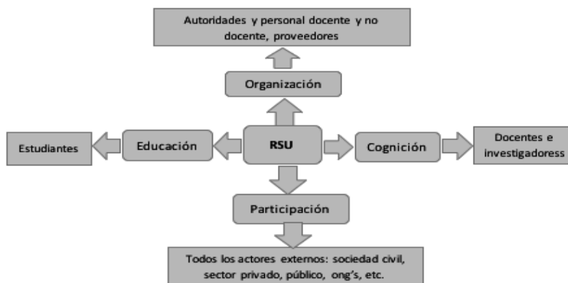
Figura 1 Tipos de impactos universitarios asociados a la RSU en la sociedad (2009)