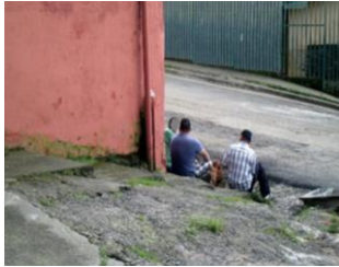
Figura 3 Personas vinculadas con la delincuencia, Los Cuadros, Purral