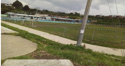
Figura 8 Cancha del polideportivo brindado por el Ministerio del Deporte y la Recreación