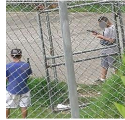
Figura 4 Jóvenes con armas de fuego, Los Cuadros, Purral