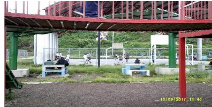
Figura 9 Algunas instalaciones del polideportivo otorgado por el Ministerio del Deporte y la Recreación