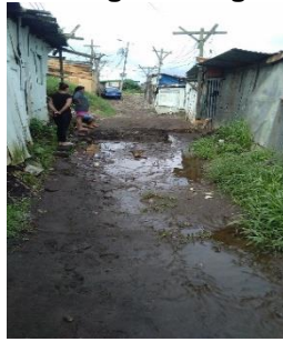
Figura 2 Aguas negras en las calles de algunos lugares de Los Cuadros, Purral