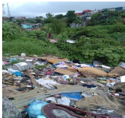
Figura 5 Suciedad en la comunidad de Los Cuadros por el desinterés de diversas personas por mantenerla limpia