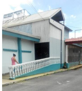
Figura 15 Persona ingresando a templo en Los Cuadros. Ejemplo de recreación espiritual