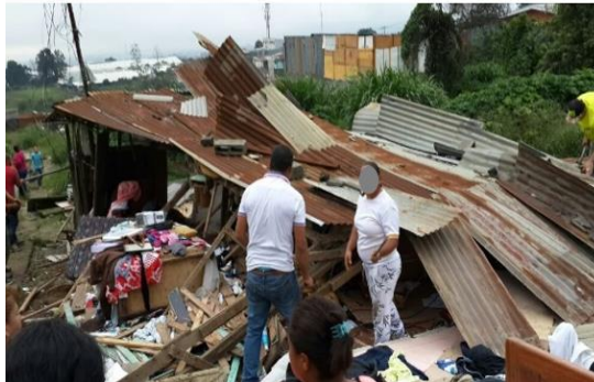
Figura 7 Demolición de rancho para iniciar un proyecto de vivienda y detener la manipulación de la pobreza en Los Cuadros, Purral