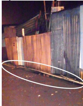
Figura 6 Tubería ilegal usada para robar agua en Los Cuadros, Purral