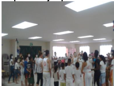
Figura 14 Grupo de capoeira. Ejemplo de recreación física