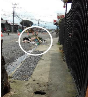
Figura 1 Basura amontonada por algunos residentes de Los Cuadros, Purral

Fuente: Rosa, participante en la investigación de Los Cuadros (2017)