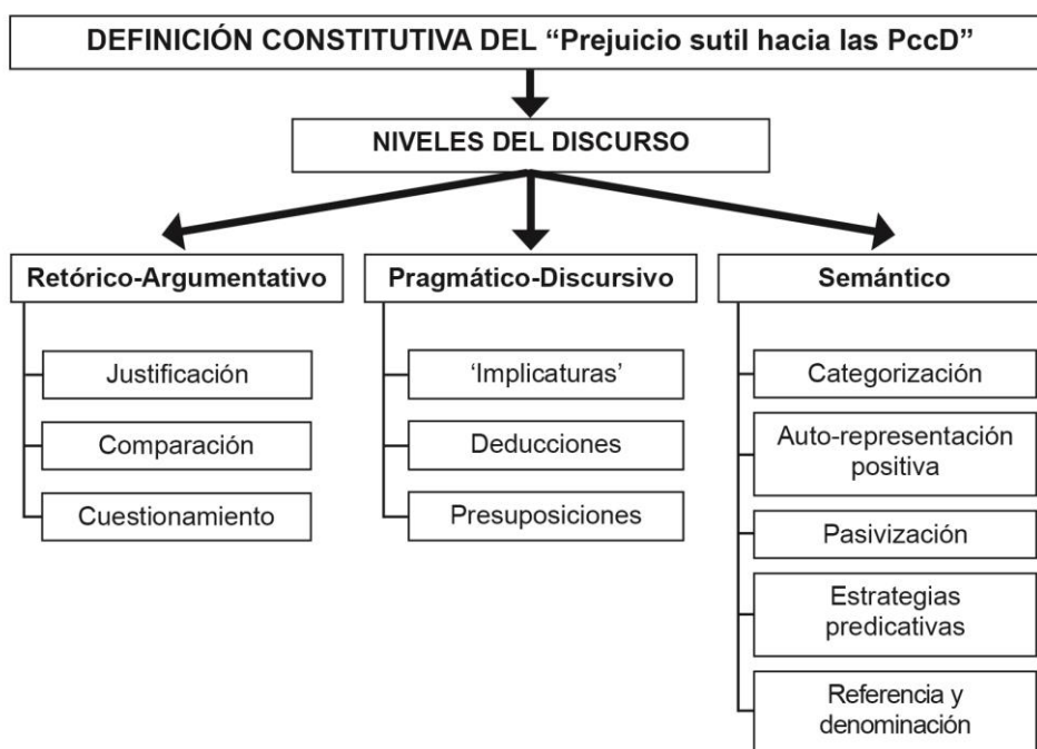
Figura 2: Definición del prejuicio sutil y niveles del discurso

A partir del análisis del discurso como estrategia investigativa que posibilita indagar y develar los prejuicios hacia las personas con discapacidad, se planteó una definición del constructo partiendo de los niveles discursivos identificados como constitutivos del mismo, tal como se muestra en la Figura 2.