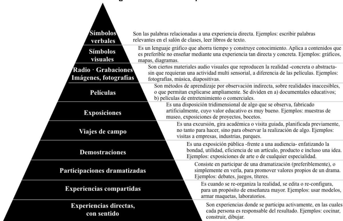
Figura 1. Cono de la experiencia 3