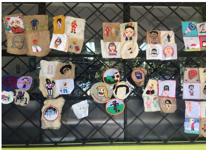
Figura 4: Proceso de montaje colectivo. Presentación final. Santiago, Chile, 2018