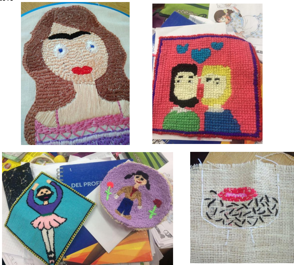
Figura 3: Ejemplos de bordado individual, elaborados por los-as estudiantes. Santiago, Chile, 2018