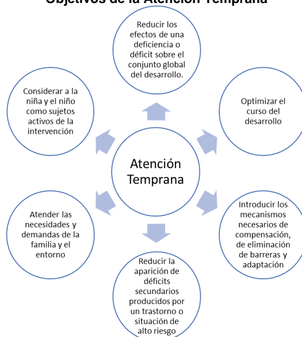
Figura 1. Objetivos de la Atención Temprana

Fuente: Adaptado de Libro Blanco de la Atención Temprana (p. 14) por Federación de Estatal de Asociaciones de Profesionales de Atención Temprana (GAT), 2005.