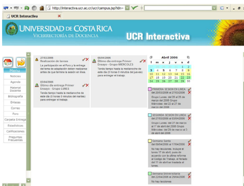
Ilustración N° 1 Agenda

El aula virtual también ofreció un espacio para poner diversos materiales al alcance de las y los estudiantes del curso. Tales fueron los casos del libro de texto, las lecturas complementarias, los ejemplos escritos y las grabaciones de audio, colocados en la carpeta Material Docente (Vea Ilustraciones N° 2 y N° 3).