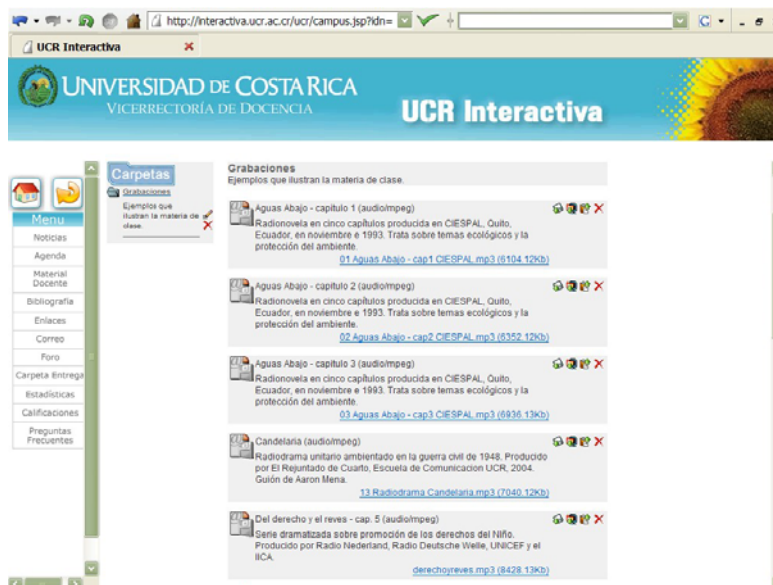
Ilustración N°3 Material docente – libro de texto