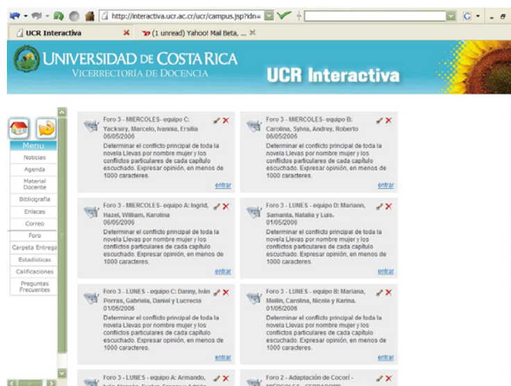
Ilustración N°4 Foros – versión mejorada

La entrega de los trabajos del curso se realizó por medio de la carpeta de entrega del aula virtual. No obstante, dados los inconvenientes de acceso y estabilidad de la plataforma, se solicitó a las y los estudiantes que, además de utilizar la carpeta de entrega, enviaran una copia de cada trabajo al correo electrónico del docente. Esto permitió contar con un respaldo digital, en caso de que UCR Interactiva presentara problemas de acceso. (Ver Ilustración N°5).