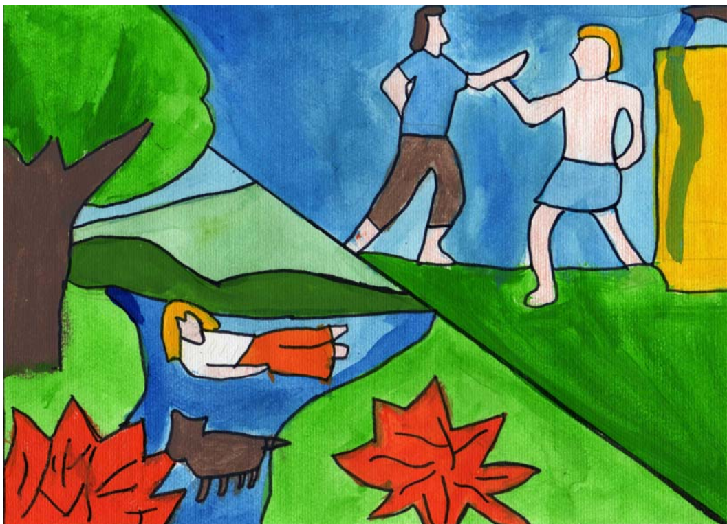
Últimos momento del Cayano

gustó y como comprendió el texto. En esta actividad la docente pudo observar como algunos comprenden el texto solo en el nivel literal, mientras que otros pueden inferir e interpretar e incluso llegar a la síntesis. En el trabajo hecho por cada estudiante se pudo observar el nivel de lectura a que accede cada uno.