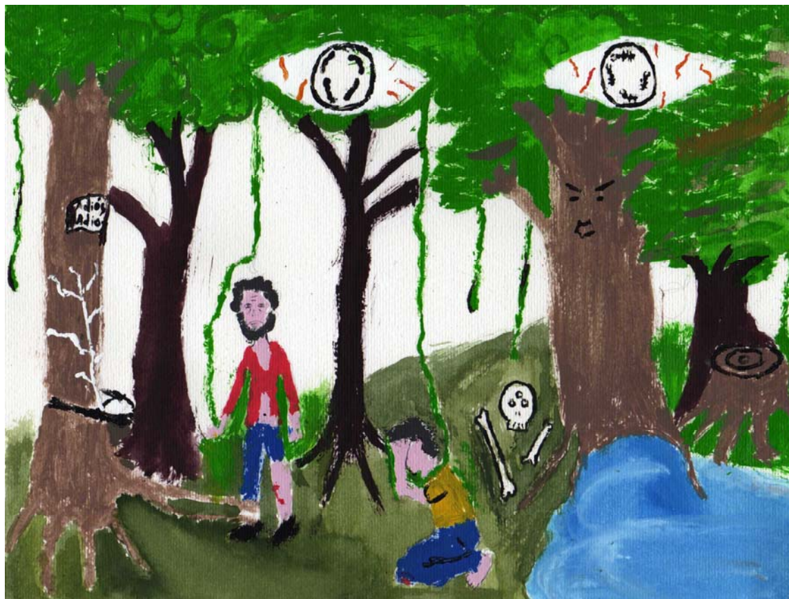
Historia de las desgracias del cuachero Clemente Silva

Otra ilustración para comentar es la penúltima que refiere la muerte del Cayeno. En ella la lectora/ilustradora presenta la acción literal pero a manera de síntesis y muestra la pelea y la muerte en una misma. Además, esta es la única de las ilustraciones donde la autora no se preocupó tanto por lo literal: poner cara a los personajes y representarlos de manera realista, sino que tiende a la abstracción y a representarlos con trazos simples pero sin buscar realismo. Hay una mayor inferencia e interpretación así como síntesis de la lectura del un fragmento.