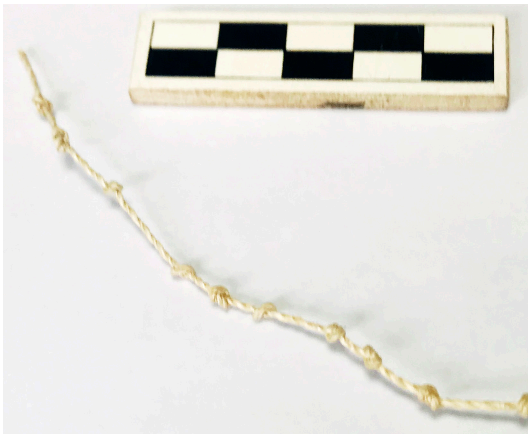
Figura 4: Modelo ngöbe de cabuya con nudos para conteo de días. Fotografía: Keilyn Rodríguez-Sánchez, julio del 2018.

Según nos comenta García, el tša 'wö más conocido se utilizaba para controlar la duración del tiempo, especialmente para cuando los bribri viajaban desde Talamanca hasta las costas del Pacífico para hacer la bola de sal 1 . Se calculaba los días desde la salida de los que viajaban hasta cuando regresaban. De esa forma, los que se quedaban en casa podían llevar la cuenta del regreso, y preparar la ceremonia de recibimiento en el tiempo preciso de la llegada de los viajeros. Señala que lo que no es correcto es que se diga que lo empleaban para el comercio o productos.