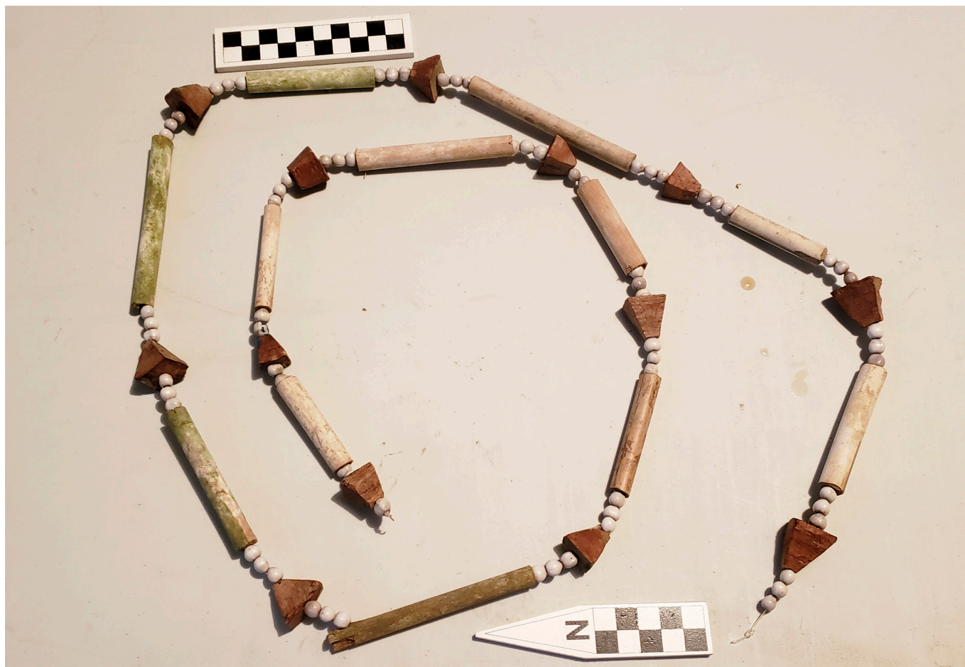
Figura 3: Sistema de registro de una vaca y sus crías en el año. Fotografía: Scott Palumbo, julio, 2018. Boruca.

Otro registro más simple es el del ganado que ha sido alimentado con sal. Veamos: