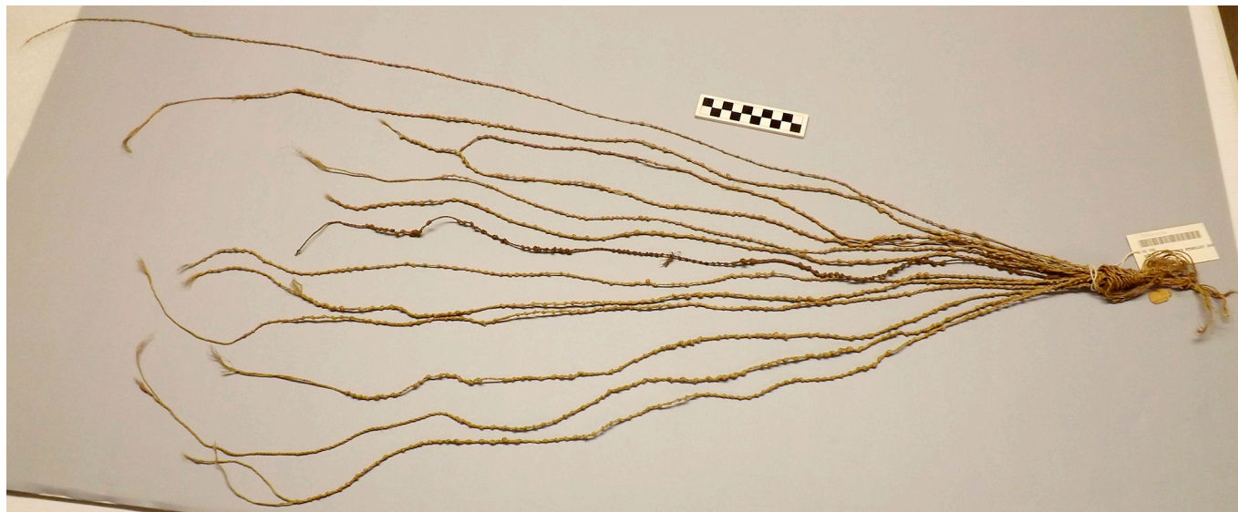
Figura 2: Modelo resguardado por Gabb, del censo de Talamanca. Fotografía tomada por Scott Palumbo, abril de 2018.

Aquellos medios de inscripción cuyas convenciones son pobremente comprendidas, probablemente no glotográficas, generan preguntas sobre lo que constituye la escritura versus otras formas de sistemas signados (Boone, 2004), esto conforma parte de los intereses de los antropólogos comparativos. Se entiende que estos medios de inscripción han cumplido una de las funciones centrales en la escritura: la transmisión de información en su forma original a través de largas distancias geográficas y de generaciones en el tiempo. Este tipo de medio fue asociado con la presencia del estado e imperio indígena a lo largo del continente americano y rara vez se vinculó con una escritura glotográfica, como sí se ha hecho en otras partes del mundo.