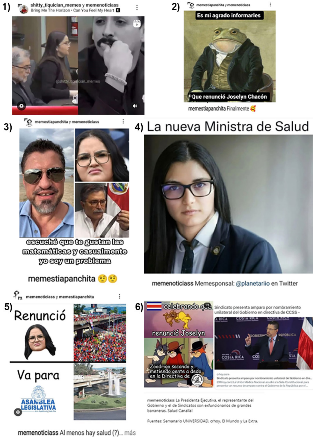
Figura 2: Memes de internet reaccionando a la comparecencia y renuncia de Joselyn Chacón.