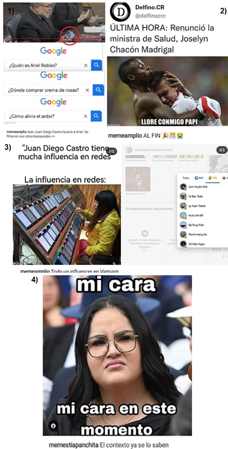
Figura 1: Memes de internet reaccionando a la comparecencia y renuncia de Joselyn Chacón.