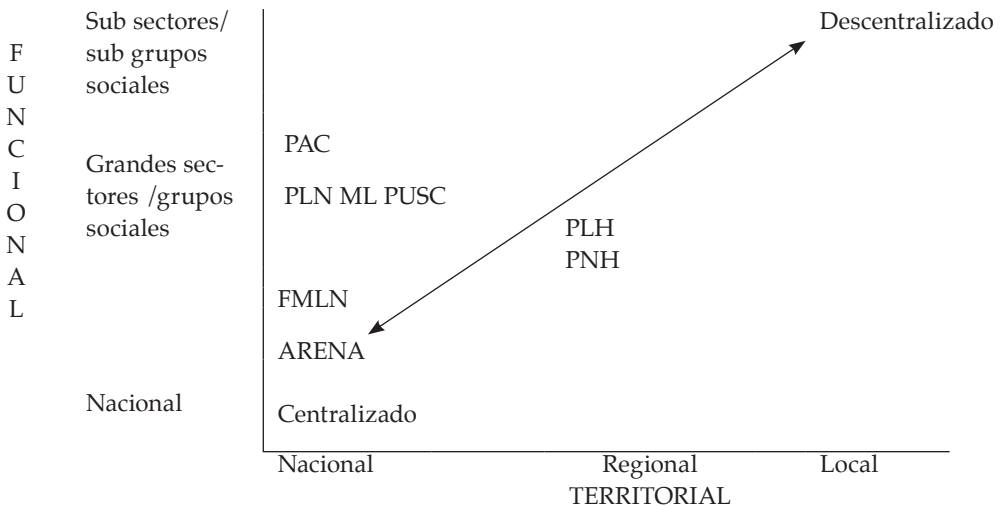
Gráfico 2 ELEMENTOS TEÓRICOS PARA EL ANÁLISIS DE LA SELECCIÓN DE CANDIDATOS: GRADO DE DESCENTRALIZACIÓN