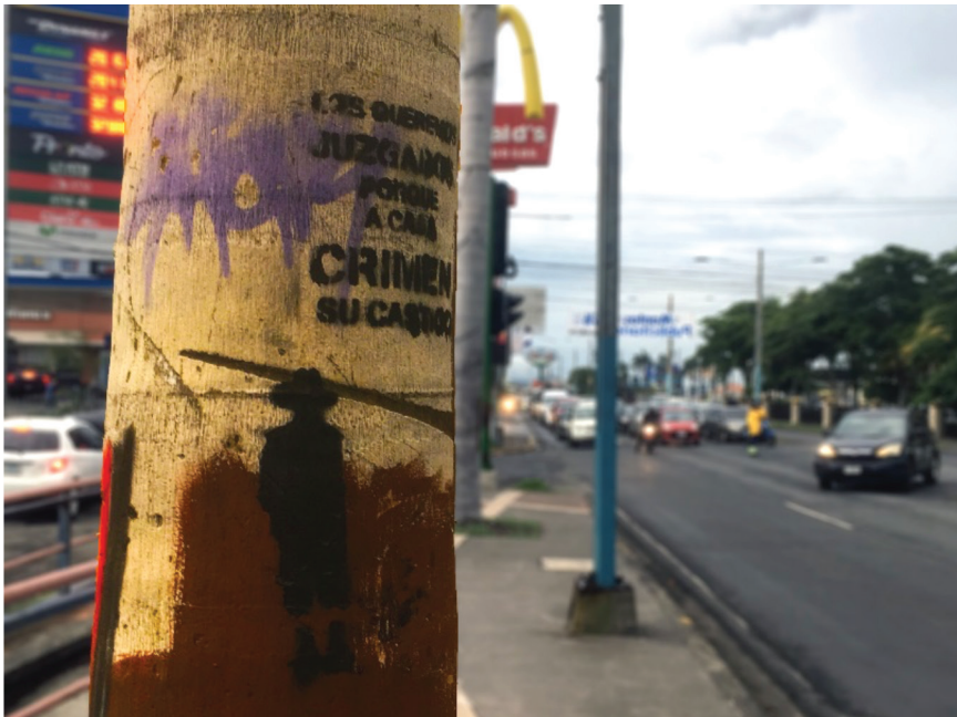
Figura 1 GRÁFICA POLÍTICA, MANAGUA, NICARAGUA