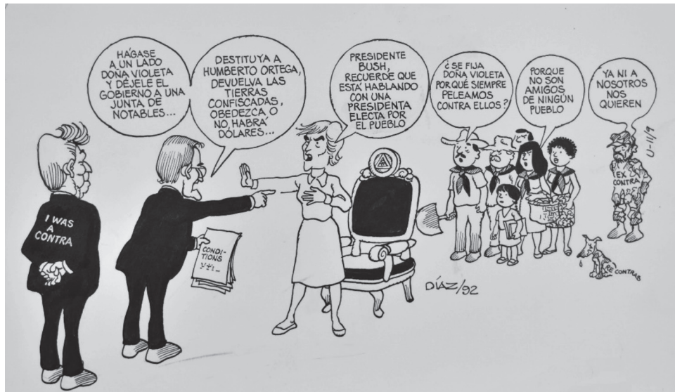
Figura 5 I WAS A CONTRA, 1992. TINTA CHINA EN CARTULINA