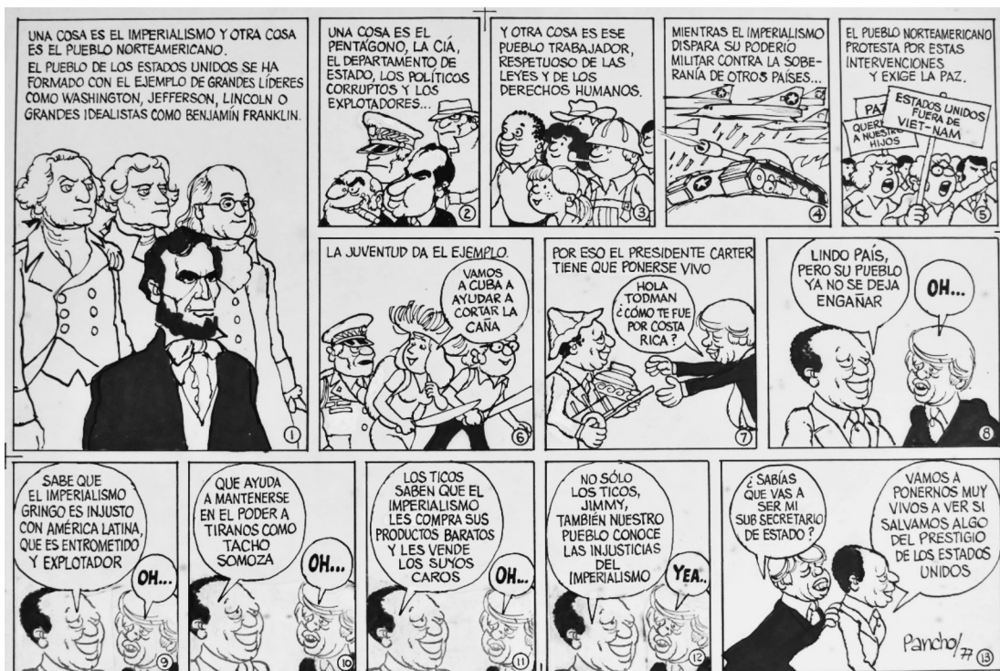
Figura 7 UNA COSA ES EL IMPERIALISMO Y OTRA COSA ES EL PUEBLO NORTEAMERICANO, 1977. TINTA CHINA

políticos de los padres fundadores del Estado norteamericano y de aquellos dirigentes reconocidos por su lucha antiesclavista. La caricatura se llama “una cosa es el imperialismo y otra cosa es el pueblo norteamericano”.