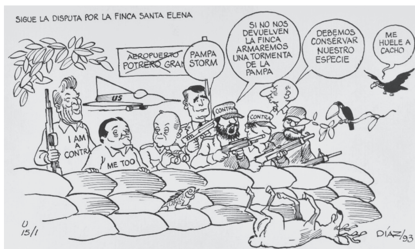
Figura 6 SIGUEN LAS DISPUTAS POR LA FINCA SANTA ELENA, 1993. TINTA CHINA EN CARTULINA