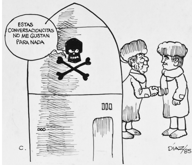
Figura 13 ESTAS CONVERSACIONCITAS, 1985. TINTA CHINA