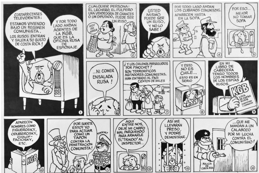
Figura 11 COSTARRICENSES TELEVIDENTES, 1978. TINTA CHINA

Se encontraron 3 imágenes sobre el tema de la Guerra Fría dos que corresponden a 1998 y el 2000 –en las cuales Díaz realiza una remembranza de lo que fue la caída de la URSS–, así como la siguiente historieta: