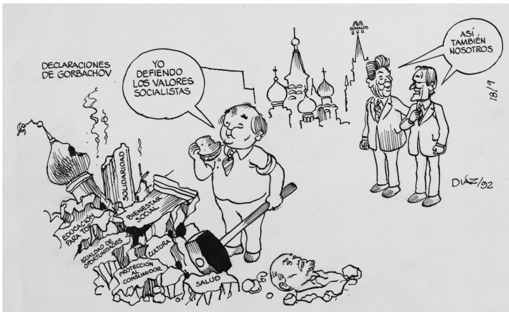
Figura 15 DECLARACIONES DE GORBACHEV, 1992. TINTA CHINA

Adicionalmente el Tío Sam y el Reino Unido identificados con las banderas y la iconografía usual, esperan su turno para reclamar los trozos de la antigua Unión Soviética. El mismo Gorbachov reacciona con sorpresa ante la escena donde se resquebraja su nación. En otra caricatura, Díaz hace otro comentario sagaz: en la Figura 15, Gorbachov mismo se trae abajo el Kremlin. Mientras tanto, atrás Reagan y Bush miran con maravilla como se cae el edificio y con este, el busto de Lenin. El líder ruso lo tumbó con un mazo que sostiene con la mano izquierda, mientras se come una hamburguesa con la mano derecha.