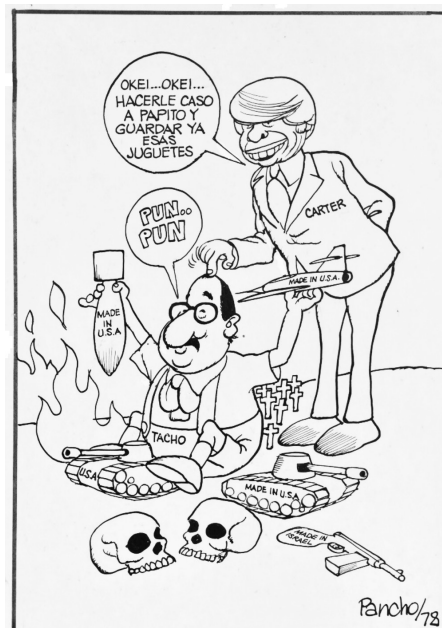
Figura 3 MADE IN PLUTARCO LUCHA POR LA LIBERACIÓN DEL PUEBLO “NICA”, 1978, TINTA CHINA EN CARTULINA

Para ejemplificar las palabras de Wilsman, tómese en cuenta la Figura 3.