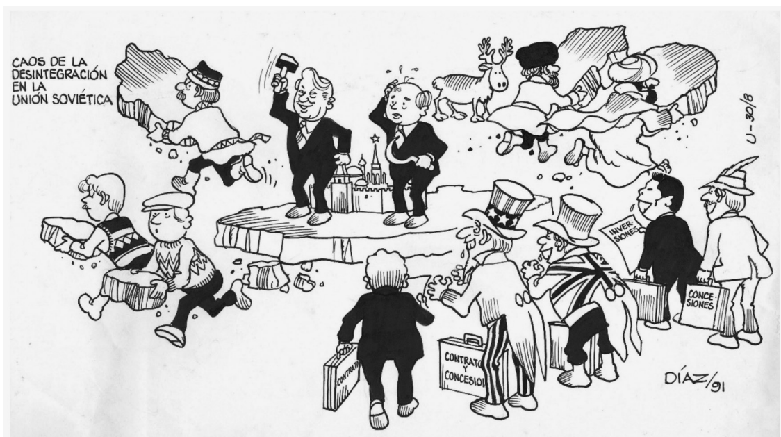
Figura 14 CAOS DE LA DESINTEGRACIÓN EN LA UNIÓN SOVIÉTICA, 1991. TINTA CHINA

La caída del bloque soviético es registrada por Hugo Díaz mediante no solo la caricatura que ya se analizó al comienzo de esta exposición, sino que también una imagen muy sugerente que aparece en 1991.