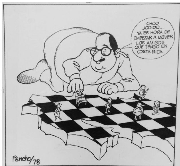
Figura 9 CHO JODIDO YA ES HORA DE EMPEZAR A MOVER LOS AMIGOS QUE TENGO EN COSTA RICA, 1978. TINTA CHINA

Díaz fue muy crítico con la postura contradictoria que toma Costa Rica en este conflicto: por un lado, parece declararse neutral en medio del conflicto, pero por otro lado no hace nada por detener la articulación de La Contra en la frontera Norte del suelo costarricense. Ejemplo de ello es la Figura 9: en ella Somoza se posiciona sobre el mapa de Costa Rica y comenta “Cho jodido ya es hora de empezar a mover los amigos que tengo en Costa Rica”. Esta es una crítica contra de la pretendida “neutralidad costarricense” frente al conflicto de la Revolución sandinista y Díaz llama la atención sobre el rol que juegan los políticos en no frenar el poder que fue amasando Somoza.