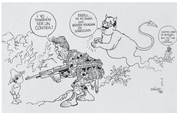
Figura 4 YO TAMBIÉN SER UN CONTRA!, 1986, TINTA CHINA EN CARTULINA

Ronald Reagan se representa en imágenes que aparecerán a lo largo de veinte años, como un gran apoyo para La Contra, en algunas caricaturas viste con una camisa que dice “I am a Contra” (Soy un Contra) y más adelante “I was a contra” [Yo era un contra]. Tómese por ejemplos las siguientes imágenes que datan de 1986 (Figura 4), 1992 (Figura 5) y 1993 (Figura 6):