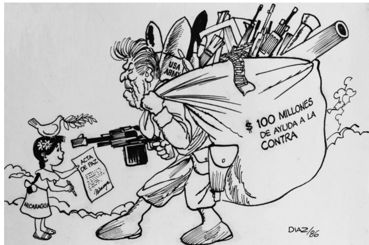
“$100 millones de ayuda a la contra”. Hugo Díaz, 1986. Semanario Universidad

Esta investigación tiene por objetivo analizar de qué manera caracteriza Hugo Díaz en sus caricaturas las acciones de actores vinculados a Costa Rica, los EE. UU. y la URSS durante la Revolución sandinista, para conocer cómo se representan las políticas exteriores que llevan a cabo estos países en el contexto de la Guerra Fría con relación al conflicto en Nicaragua, entre 1974-1994. Gracias al acceso concedido por los MuseosUCR a la colección que el artista mismo le donó a la Universidad de Costa Rica se tuvo acceso al acervo de Hugo Díaz. Actualmente, el museo cuenta con más de cuatro mil caricaturas catalogadas. El Semanario Universidad posee caricaturas del artista también, y estas obras no se encuentran disponibles al público ni están incluidas en la colección de MuseosUCR. Debido al limitado acceso que se tiene al corpus de dibujos del Semanario Universidad , este no se pudo revisar para esta investigación.