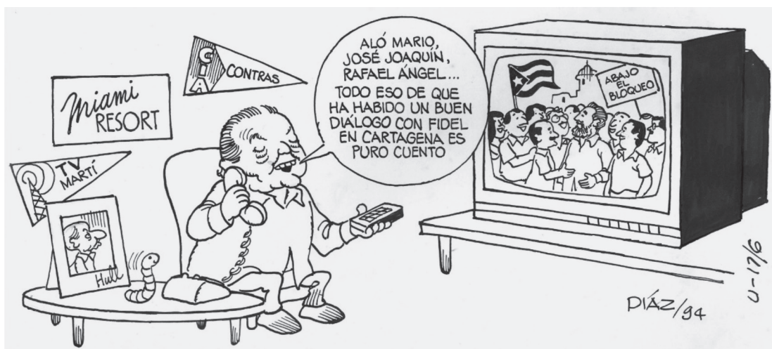
Figura 10 MONGE, 1994. TINTA CHINA

En la Figura 10, Díaz representa al entonces expresidente Luis Alberto Monge en Miami hacia 1994. Monge mira en el televisor la situación que se estaba desarrollando en torno al bloqueo económico de los EE. UU. frente a Cuba. Desde 1992, la potencia había estado implementado sanciones económicas contra Cuba como “The Cuban Democracy Act” de 1992. Lo que interesa de la caricatura con relación al personaje, es resaltar la pequeña bandera con la que Hugo Díaz adorna la habitación de Monge: sobre la cabeza del personaje se puede ver una bandera triangular que dice “CIA-CONTRA”. Esta decoración se asemeja a los souvenirs que coleccionan los seguidores de un equipo deportivo. En este caso el banderín, un motivo tan pequeño y simbólico presente en el dibujo, implica que Monge fue sino colaborador al menos fanático del “equipo” CIA-Contra.