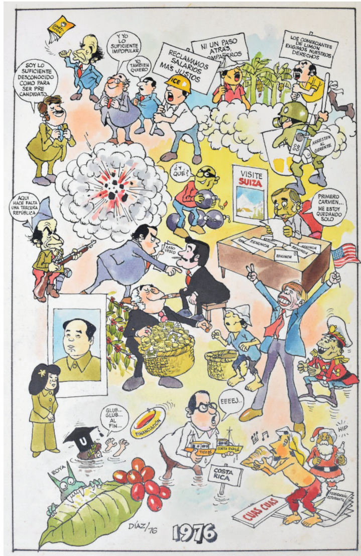
Figura 12 1976, 1976. TINTA CHINA