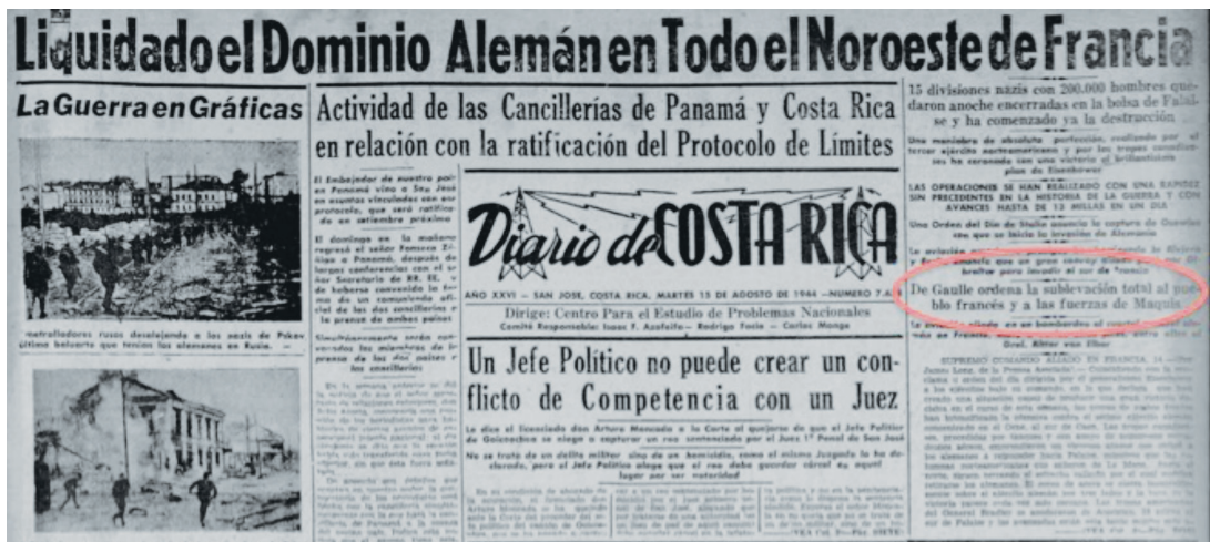
Figura 9 LIQUIDADO EL DOMINIO ALEMÁN