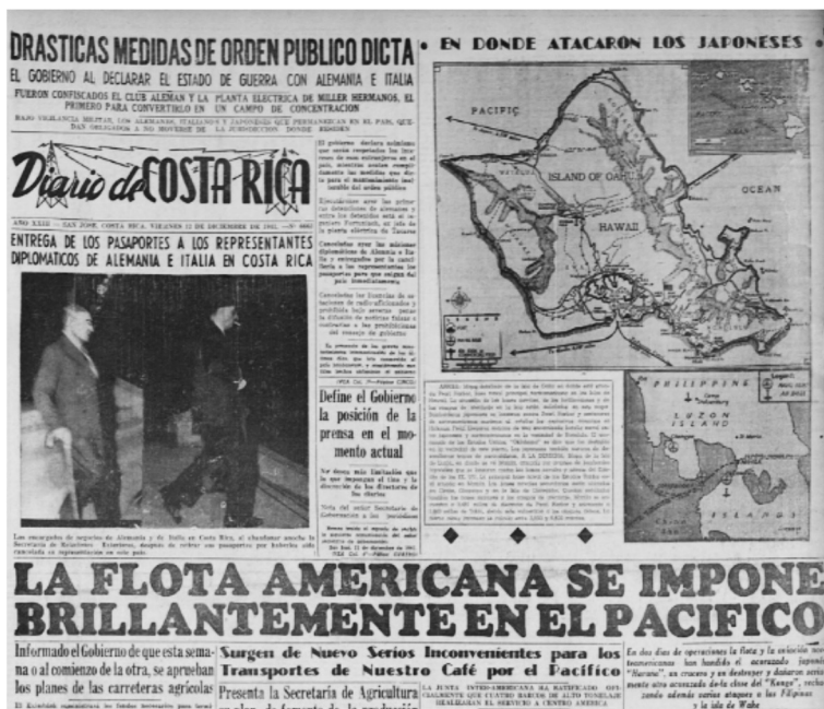
Figura 6 MOVIMIENTOS BÉLICOS