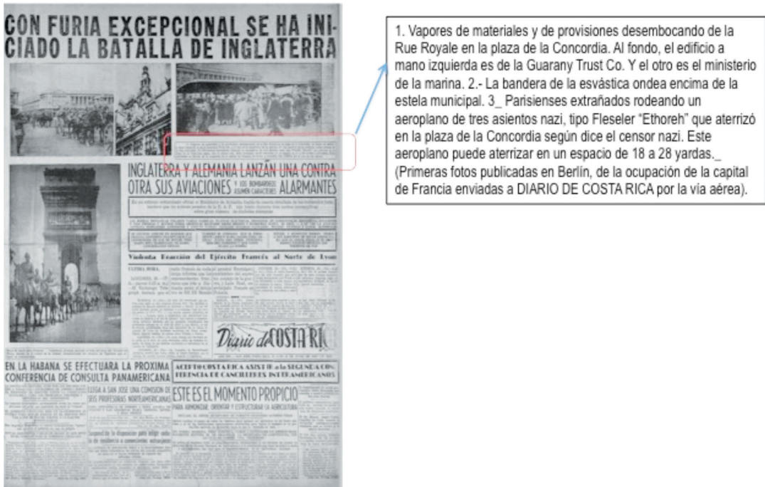
Figura 3 PRESENCIA ALEMANA EN LA CAPITAL FRANCESA