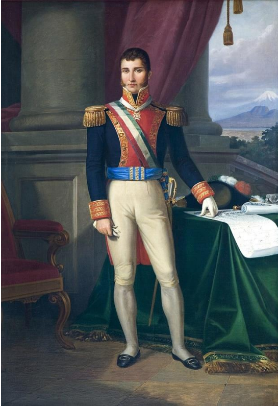
Figura 4 Retrato de Agustín I de México