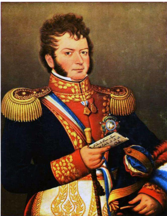
Retrato de Bernardo O'Higgins