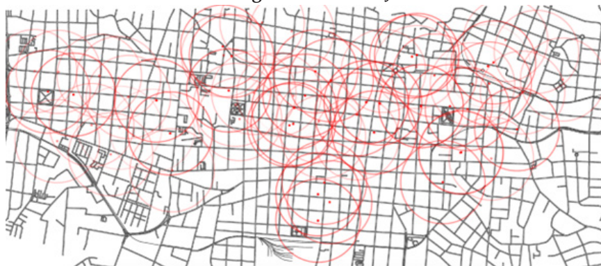
Figura 6. Cartografía de los rangos de acción de los dispositivos de videovigilancia en San José

tamento y privilegió la prevención y el castigo de cualquier acto ilícito. Esta red se enfocó en la inspección de detalles personales con el propósito de influenciar, cuidar y controlar a una población determinada, o parte de ella, transformando lo observado en datos que, además, podían ser generados, procesados, categorizados y, sobre todo, empleados para dominar un sitio (Lyon 1994).