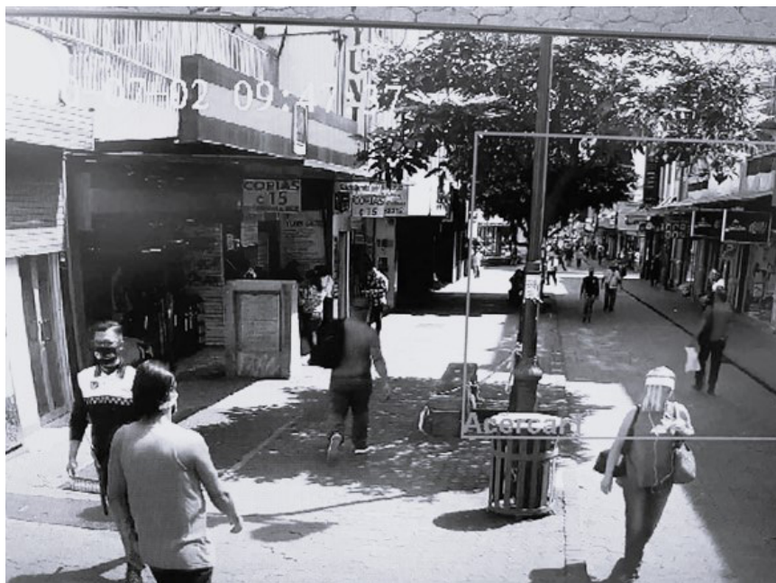
Figura 7. Imagen de la Avenida Central capturada por dispositivos de videovigilancia