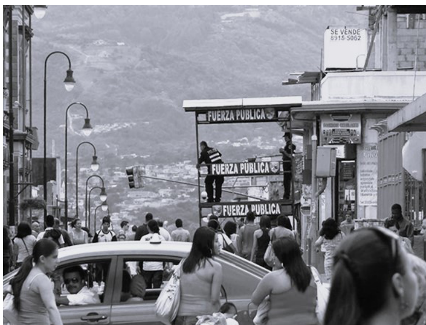
Figura 3. Fotografía de torre policial instalada durante fin de año en Avenida Central, 2010