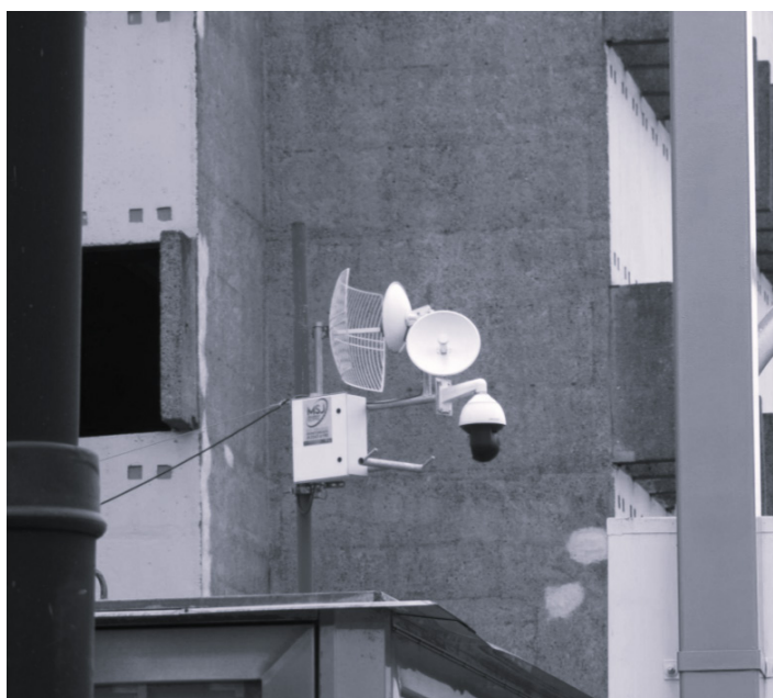
Figura 5. Fotografía de disposición de una cámara de videovigilancia

se han colocado en los barrios: Cristo Rey, B° Cuba y Distrito El Carmen. El Departamento de Seguridad Ciudadana y Policía Municipal con tecnología de punta asegurará a los habitantes y transeúntes la estadía en el Cantón Central, así mismo, resguardará la infraestructura, de modo que evitará que delincuentes infrinjan la ley o bien, poder capturar imágenes que faciliten la identificación de personas no deseables y así prestar este servicio al ciudadano que lo requiera para identificar cuando ha sido víctima de robo o asalto. (Dirección de Seguridad Ciudadana y Policía Municipal 2010, 1)