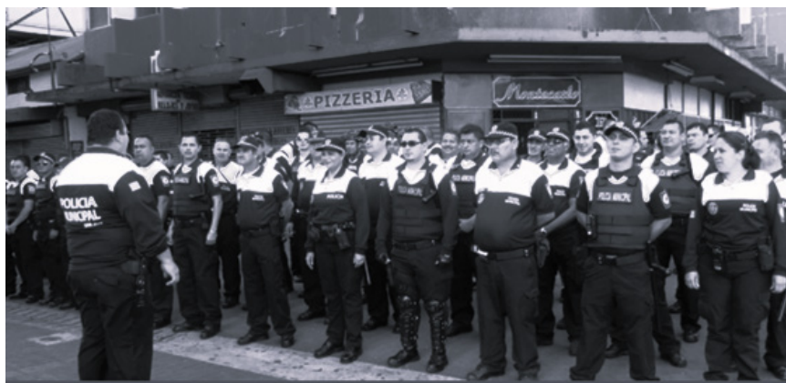
Figura 2. Fotografía de la Policía Municipal con declaración de sus labores. 2011