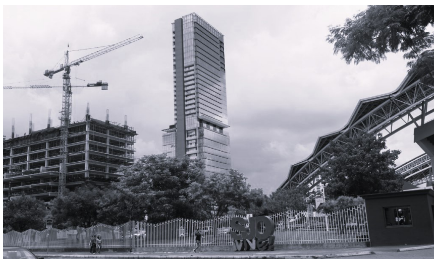
Figura 4. Fotografía de un desarrollo inmobiliario en La Sabana