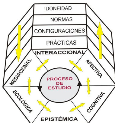
Figura 1: Facetas y niveles de análisis didáctico

Para las facetas epistémica y ecológica de la actividad matemática se asumen presupuestos antropológicos/ socioculturales (Bloor, 1983; Chevallard, 1992 y Radford, 2006); en cuanto a las facetas cognitivas y afectivas se adoptan presupuestos semióticos (Éco, 1976; Hjelmslev, 1943 y Peirce, 1931-58); y para la faceta instruccional (interaccional y mediacional) se asume una perspectiva socio-constructivista (Brousseau, 1997 y Ernest, 1998). Se reconoce la complejidad de los procesos de enseñanza – aprendizaje de las matemáticas, por las interacciones sistémicas entre las distintas facetas y componentes, asumiendo un paradigma de complejidad sistémica como propone Morin (1994) 3 . Dichas facetas se deben analizar según diversos niveles: las prácticas o acciones de los agentes implicados, las configuraciones de los objetos intervinientes, las normas que condicionan y soportan la realización de las prácticas y la valoración de la idoneidad o adecuación del proceso educativo en toda su globalidad (Godino, Font, Wilhelmi y De Castro, 2009).