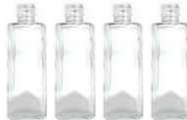
Botellas de \frac{1}{2} litro