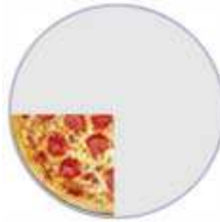
\frac{1}{4} (Un cuarto)