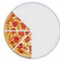
\frac{3}{8} (Tres octavos)