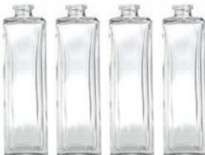
Botellas de 1 litro