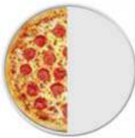
\frac{1}{2} (Una mitad)