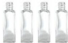
Botellas de \frac{1}{4} litro