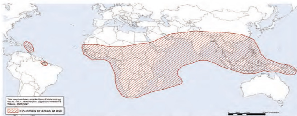
Figura #1 Áreas en riesgo de Fiebre Chikungunya hasta agosto del 2014

Actualmente el virus se ha propagado a regiones como Europa, Australia y América desde regiones endémicas debido a que los viajeros regresan a sus hogares con alta viremia, convirtiéndose en fuentes de infección.