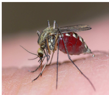
Figura #2 Mosquito Aedes spp

LOS MOSQUITOS IMPLICADOS EN LA TRANSMISIÓN SON AEDES AEGYPI Y AEDES ALBOPICTUS DOS ESPECIES QUE TAMBIÉN PUEDEN TRANSMITIR OTROS VIRUS COMO EL DEL DENGUE