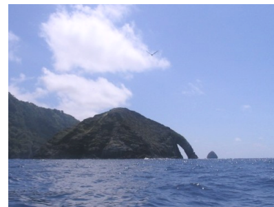
Fotografía 25: Isla Muela y su Arco de Benito.

La belleza primitiva de la Isla del Coco se aprecia en una escultura hecha por el mar a través de los siglos en la Isla Muela, ubicada entre Cabo Dampier y Bahía Yglesias. Un túnel o puente volcánico al sureste de la isla, conocido por tiempo inmemorial como el Arco de Benito (fotografía 25).