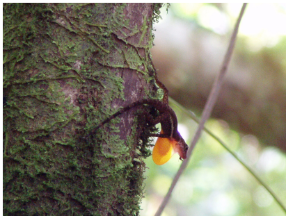
Fotografía 20: lagartija de la Isla del Coco.

Saliendo de las cavernas y emprendiendo el descenso, tuvimos la suerte de observar uno de los reptiles que existe en el territorio insular, el anolis o lagartija de la Isla del Coco, la cual es una especie endémica (fotografía 20).