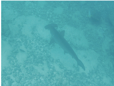
Fotografía 17: tiburón martillo.

Observamos en la profundidad de Chathan un tiburón martillo rastreando el fondo arenoso (fotografía 17), y a la distancia, en los linderos de Manuelita, un tiburón sedoso.