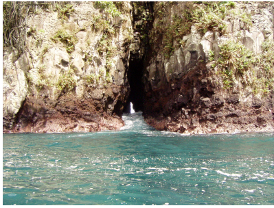
Fotografía 5: Península Presidio.

Al descender de la panga, iniciábamos nuestra permanencia en el sitio que nos albergaría durante los siguientes siete días (fotografía 6).