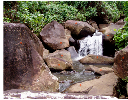
Fotografía 13: quebrada Lièvre.

Se cree que muchas de ellas fueron realizadas por piratas y más adelante por marinos de los barcos balleneros que visitaban la isla en busca de refugio y abastecimiento. Los análisis actuales señalan como la inscripción más antigua la que corresponde a un buque británico en el año 1797.