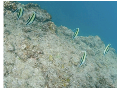
Fotografía 15: ídolos moros.

Conteniendo la respiración, nos sumergimos y pudimos apreciar y fotografiar varios erizos de mar y unos hermosos ídolos moros, peces típicos de los arrecifes (fotografía 15).