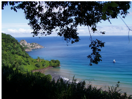
Fotografía 12: Bahía Chatham.

Iniciando el descenso, se logra observar el otro lado de la isla y se aprecia la magnitud y belleza de Bahía Chatham y se logra ver la Isla Manuelita (fotografía 12).