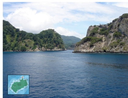
Fotografía 4: Estrecho de Challe.

Ingresamos al estrecho de Challe, pasaje natural de gran belleza que separa la Isla del Coco de su compañera de mayor tamaño, la Isla Manuelita (fotografía 4).