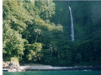
Fotografía 18: catarata.

metros hasta una poza oculta para el observador desde el mar (fotografía 18).