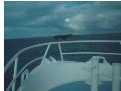
Fotografía 2: "booby".

las aguas, cual si fuesen verdaderos pájaros. Lo hacían individualmente, pero en un número muy frecuente de ocasiones.