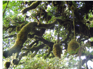
Fotografía 23: bosque nuboso.

El ingreso al bosque nuboso es algo extraordinario, principalmente considerando la latitud en que se encuentra la Isla del Coco, lo cual la vuelve más interesante aún, para todos aquellos amantes y estudiosos de la naturaleza (fotografía 23).