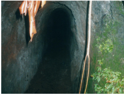
Fotografía 19: caverna de Gissler.

La profundidad de las mismas es testigo del tesón que los hombres aplicaban en busca de la fortuna. Tres cavernas que se encuentran una sobre otra en la montaña cercana a Bahía de Wafer, no muy lejanas al sitio donde hoy en día se encuentra Villa Beatriz.