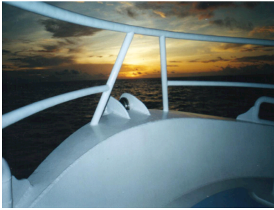
Fotografía 3: amanecer en la isla.

Otro periodo importante en la historia de la isla corresponde a la búsqueda de los tesoros. En las décadas de los años veinte y treinta del siglo XX, como resultado de la publicación en Inglaterra del libro “ Searching for Treasure in Cocos Island ”, del explorador Malcolm Campbell, dio inicio una campaña internacional organizada desde Costa Rica por el periodista inglés Julian Weston, para dar a conocer la isla a nivel mundial. El libro de Campbell junto al trabajo desarrollado por Weston, dio por resultado un gran interés por la isla y sus tesoros ocultos, por parte de aventureros anglosajones.