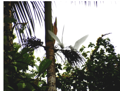
Fotografía 10: charrán blanco.

Las "palomas del espíritu santo", como popularmente le llaman al charrán blanco (fotografía 10), por su semejanza con el ave mítica de la religión católica, se acercan a los caminantes con el objetivo de salvaguardar su territorio, pero que según los antiguos visitantes, lo hacían como ofreciendo "protección celestial".