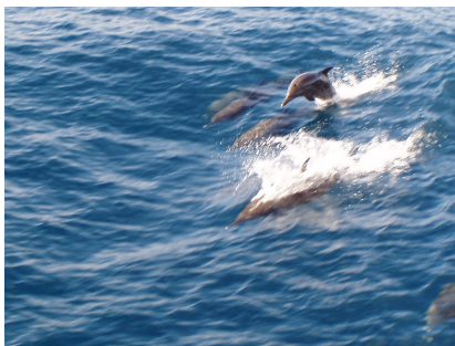
Fotografía 22: delfines nariz de botella.

El viaje de ida fue adornado por fogosos delfines que saltaban con entusiasmo propio de estos cetáceos cuando se encuentran al lado de una embarcación en alta mar. Saltan cual malabaristas, realizando vistosos impulsos acrobáticos (fotografía 22).