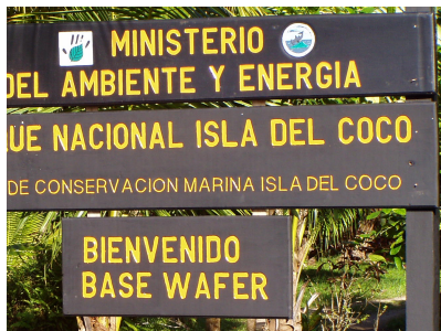
Fotografía 6: Base Wafer.

Al descender de la panga, iniciábamos nuestra permanencia en el sitio que nos albergaría durante los siguientes siete días (fotografía 6).