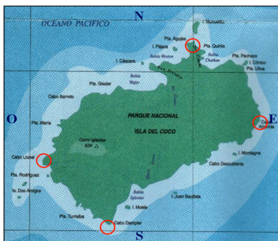
Figura 1: mapa oficial de Costa Rica.

Sus líneas extremas son: por el norte Punta Agujas; por el sur Cabo Dampier; por el oeste Cabo Lionel; y al este Cabo Atrevida. Tiene una extensión de casi 24 km 2 , siendo de importancia en su geografía e historia las bahías Chatham y Wafer en las partes noreste y noroeste de la isla, respectivamente (Figura 1).