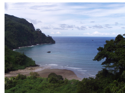
Fotografía 11: Bahía Wafer.

En uno de los puntos altos del trayecto, se encuentra un área destinada a mirador, donde se logra ver la desembocadura del río Genio y el hermoso paisaje de Bahía Wafer en todo su esplendor (fotografía 11).