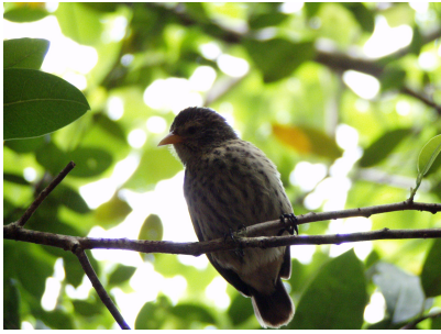
Fotografía 9: pinzón de la Isla del Coco.

En los estudios naturalistas de Darwin en las Islas Galápagos, el científico describió trece especies de pinzones endémicos. El pinzón de la Isla del Coco, es la decimocuarta especie de pinzones descubierta.