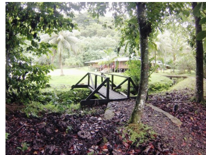
Fotografía 7: Villa Beatriz.

Emprendimos el camino hacia "Villa Beatriz", único albergue en Coco (fotografía 7).