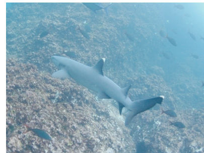
Fotografía 16: tiburón punta blanca.

Sin embargo, el momento tenía que llegar; divisamos en la profundidad del arrecife un tiburón punta blanca. La emoción fue tal, que nuevamente decidimos sumergirnos en busca de tan valioso trofeo, una fotografía del esqualo (fotografía 16).