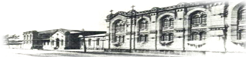
Hospital San Juan de Dios. San José. Costa Rica. Fundado en 1845