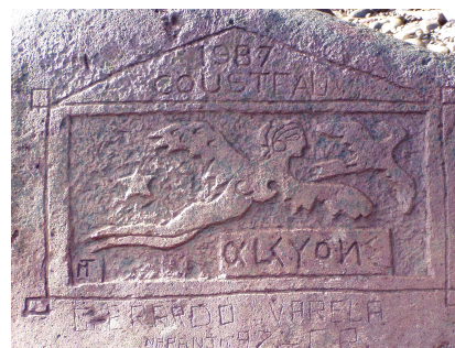
Fotografía 14: epígrafe de la Sociedad Cousteau.

Las inscripciones incluyen además expediciones naturalistas, de buscadores de tesoros y de científicos; pudiéndose observar en la costa, un grabado en relieve con el emblema de la Sociedad Cousteau, tallado en una gran piedra por uno de los miembros de la expedición del Alcyon, recordando su visita por espacio de dos meses en 1987 (fotografía 14).