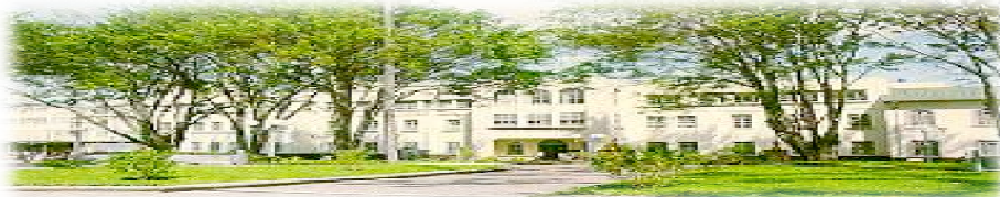
Hospital San Juan de Dios, San José, Costa Rica. Fundado en 1845