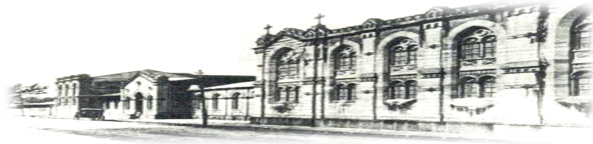
Hospital San Juan de Dios. San José, Costa Rica. Fundado en 1845