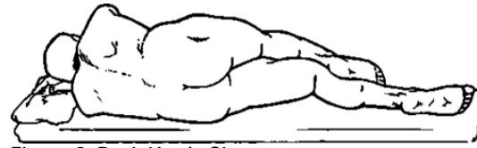
Figura 2. Posición de Sims

Se recomienda explorar al paciente en posición de Sims, decúbito lateral izquierdo con las piernas flexionadas sobre el abdomen, en diagonal sobre la camilla, con el hombro derecho ligeramente inclinado hacia el lado izquierdo, favoreciendo de este modo la exposición anal y perianal.