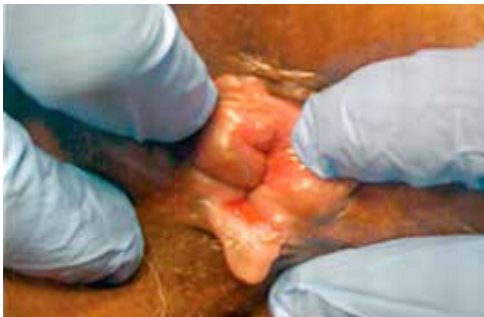
Figura 5. Fisura anal crónica con pliegue centinela.

Fuente: Gastroenterology & Hepatology Volume 10, Issue 5 May 2014