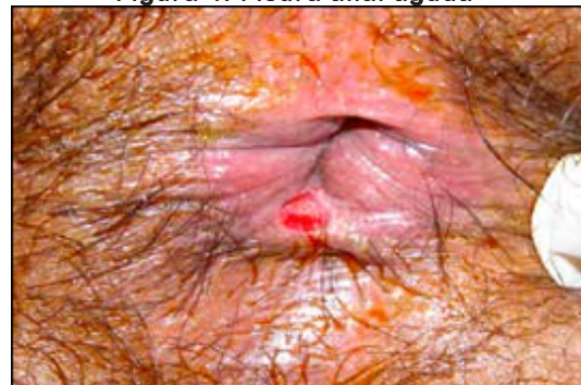
Figura 4. Fisura anal aguda