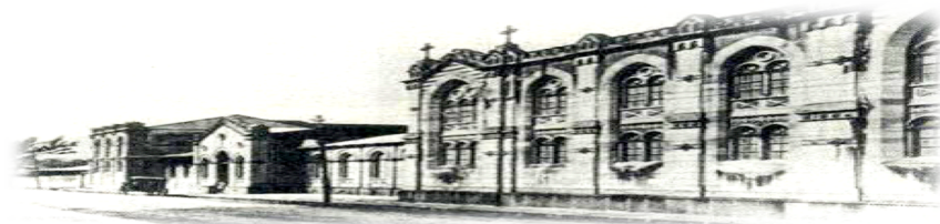
Hospital San Juan de Dios. San José, Costa Rica. Fundado en 1845