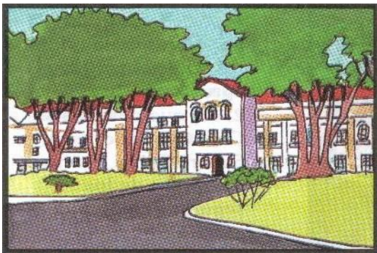
Figura 1: Dibujo del Costado Este del Hospital San Juan de Dios (“ Puerta de Médicos ”).

sus largos corredores, jardines y grandes salones generaba algo especial en quienes llegábamos a él para nuestra formación académica y profesional. El hospital “ cuna ” de la Medicina y de las ciencias médicas de nuestro país.