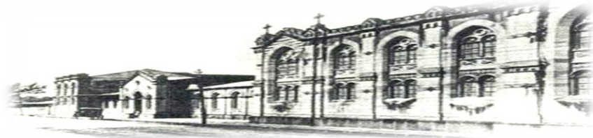
Hospital San Juan de Dios, San José, Costa Rica. Fundado en 1845