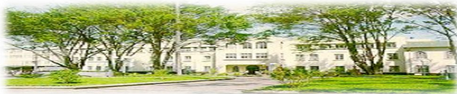
Hospital San Juan de Dios, San José, Costa Rica. Fundado en 1845