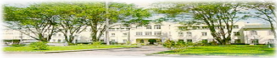
Hospital San Juan de Dios, San José, Costa Rica. Fundado en 1845