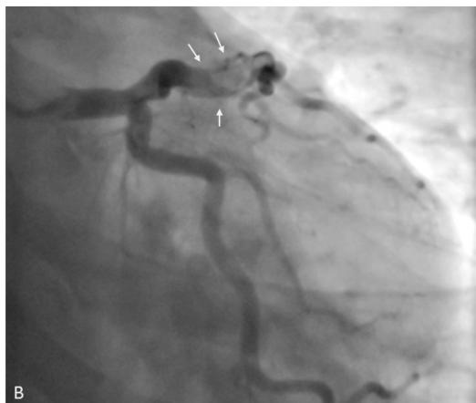
Figura 1. Ay B: Angiografía coronaria con defecto de la captación del medio de contraste en la arteria descendente anterior