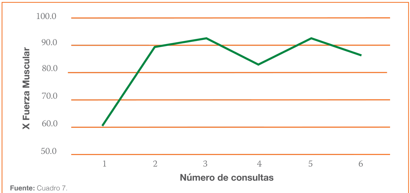
■ Cuadro 8 Promedio de fuerza muscular por grupo muscular por año con tratamiento