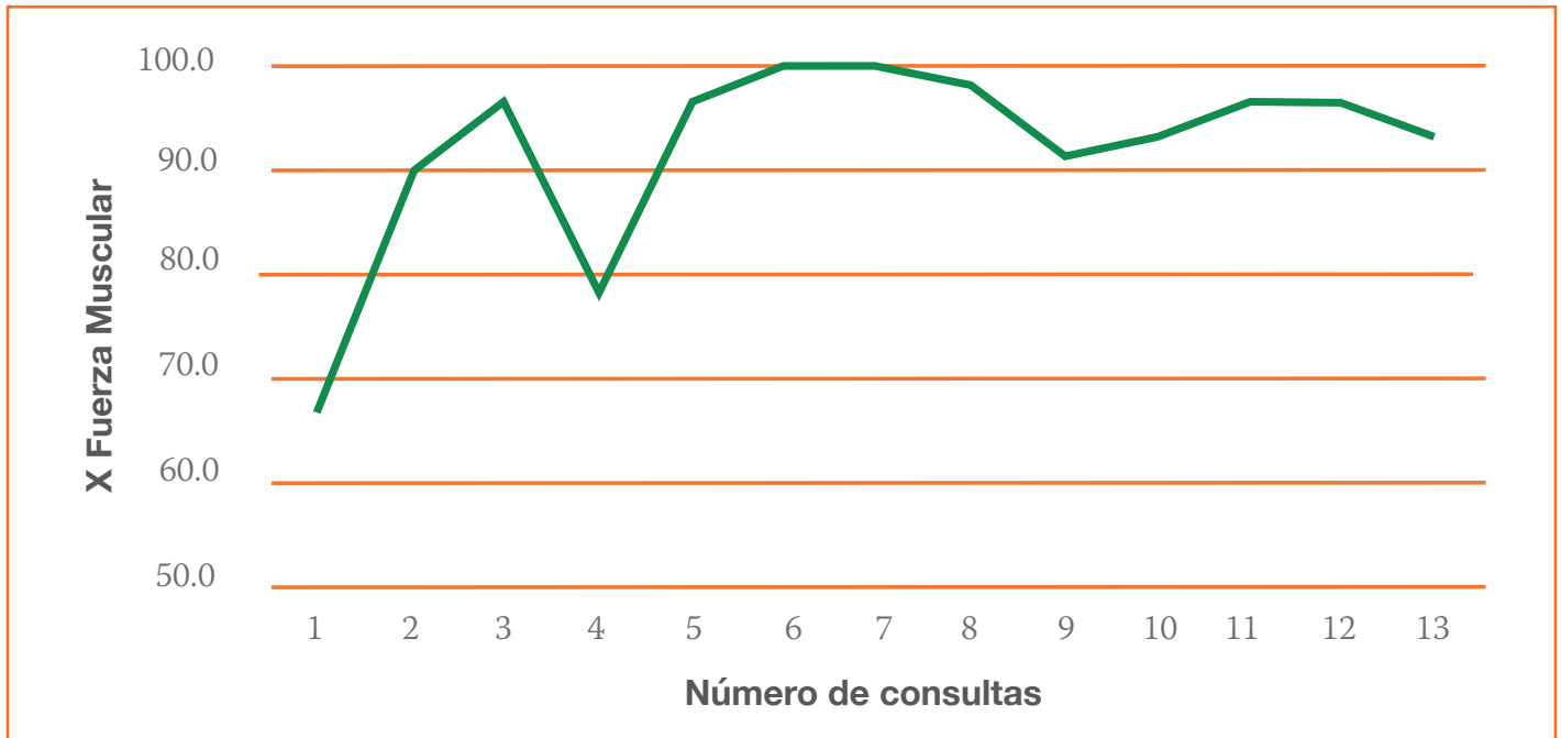
■ Cuadro 2 Promedio de fuerza muscular por grupo muscular por año con tratamiento neostigmina