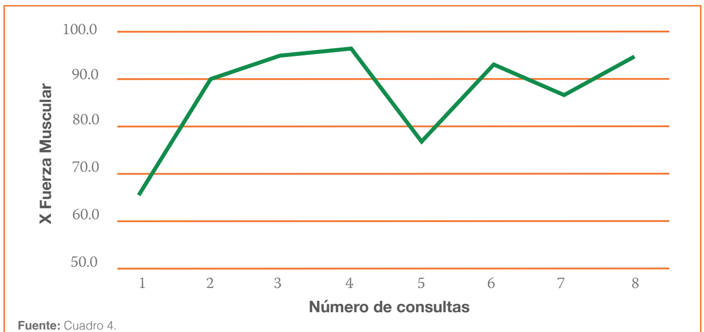
■ Gráfico 2 Promedio de fuerza muscular

FMI= 65% al mes PNFMI 90% (AFM 38.5%), mes 12 PNFMI 94,9% (AFM, 46%) DFM mes 5, PNFMI 76.6- (DFM 20.7%), mes 7 PNFMI 86.6% DFM 7.1%.