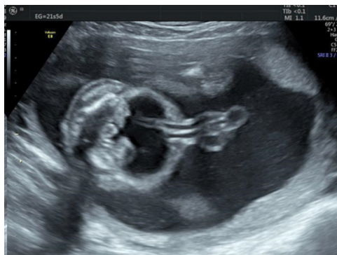
Figura 2: Feto hidrópico antes de realizar la primera transfusión a las 22 semanas de edad gestacional (SEG). Vista sagital del abdomen.

Abreviaturas: SEG (semanas de edad gestacional), PFE (peso fetal estimado) VPS-ACM (velocidad pico sistólica de la arteria cerebral media) Hb (hemoglobina) Hto (hematocrito)