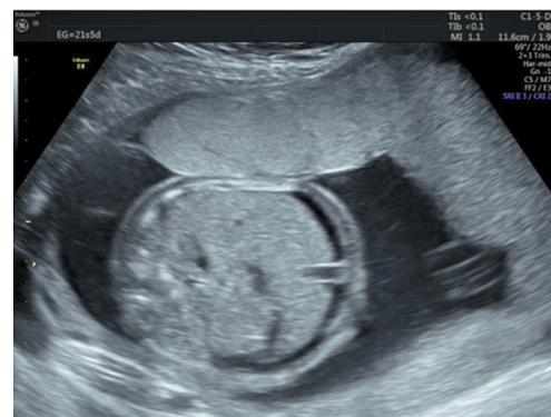
Figura 1: Feto hidrópico antes de realizar la primera transfusión a las 22 semanas de edad gestacional (SEG). Vista transversal.

La última TIU se realizó a la semana 32.4, previa colocación de esquema de maduración pulmonar. La interrupción del embarazo por cesárea se realizó a la semana 36.0, obteniendo una recién nacida femenina de 2600 g con Apgar 8-8. Fue trasladada al día 3 de nacida de nuestro centro hospitalario al hospital de Guápiles, en donde fue egresada a las 2 semanas con oxígeno suplementario por nasocánula con excelente evolución clínica.