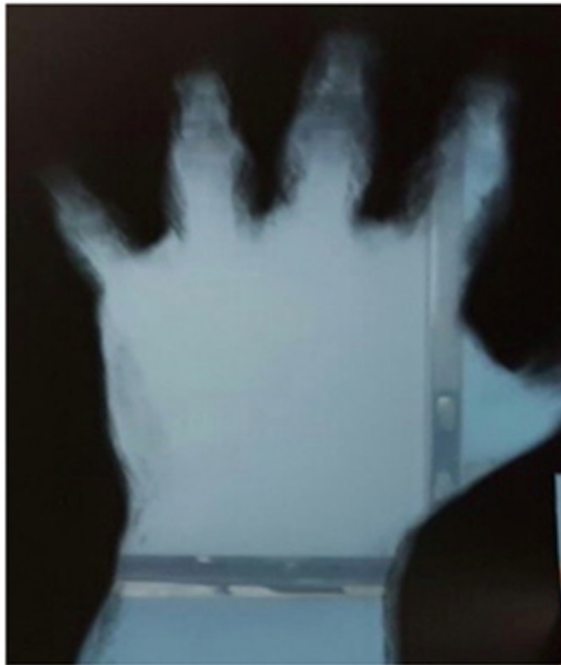
Figura 2: Radiografía simple que demuestra la extravasación de medio de contraste.