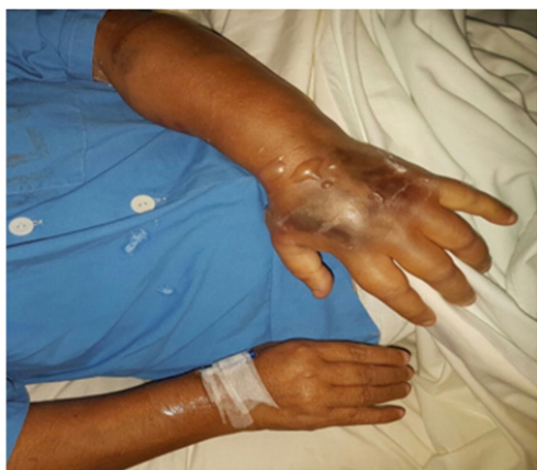
Figura 1: Paciente con extravasación de medio de contraste, donde se observa el edema y presencia de ampollas en el miembro superior izquierdo.

Es relevante mencionar que los grados de dolor son subjetivos, mientras que los grados de eritema y edema son percibidos por el explorador, por lo que el juicio clínico en esta entidad es de suma importancia. Además, se debe recordar que el edema en este contexto se genera fisiopatológicamente por aumento de la permeabilidad de los vasos sanguíneos debido a la citotoxicidad y por aumento de la presión oncótica en el espacio intersticial (este último en el caso de medios de contraste hiperosmolares), por lo que el edema generado por EMC usualmente es positivo para el signo de la fóvea (9).